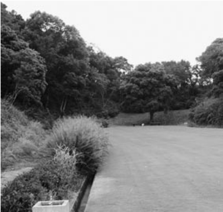
設置予定場所（小目津公園）

A 以前から遊具の整備をと宝くじの助成を申請していましたが、今回、助成が決定しましたが、それは遊具本体の整備費だけで、造費や周辺整備は助成の対象になっていませんので、ご理解下さい。