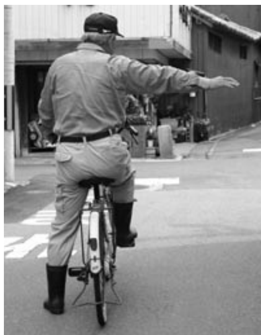
ハンドサインが必要

子供の交通安全教室は毎年実施しており、又校長方には、自転車の正しい乗り方について、指導の徹底を計るよう指示しています。又保護者会を通じてもお願いしています。