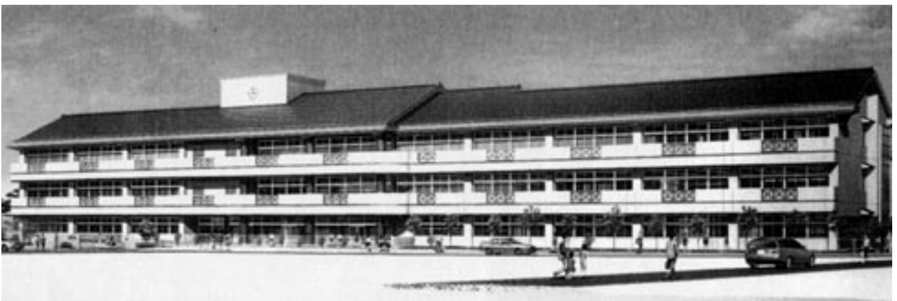
南部小新校舎イメージ

臨時議会には他に、国保税条例の一部改正案、一般会計補正予算案などが提案され審議されましたが、いずれも可決されました。