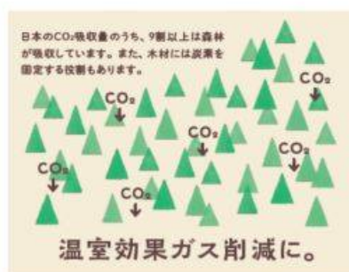
温室効果ガスの削減