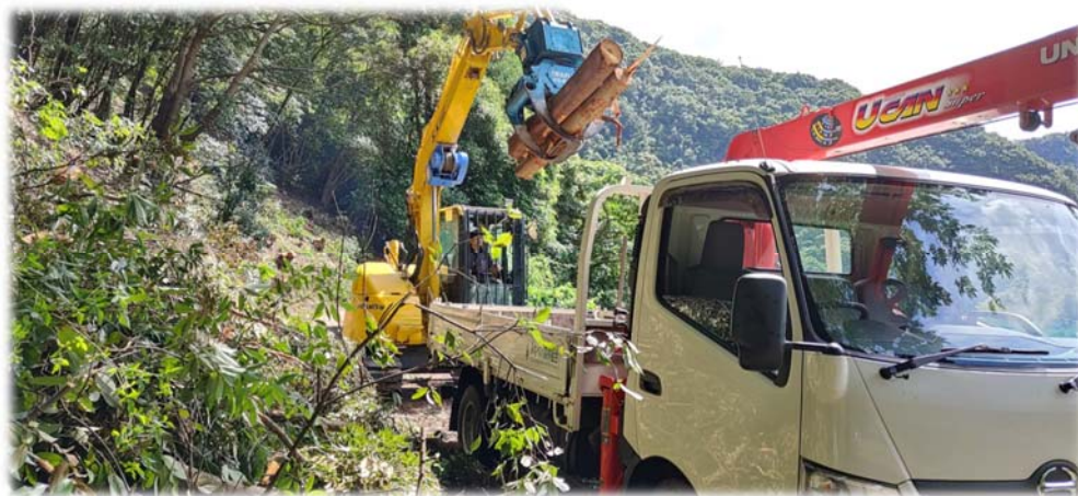
＜伐採した雑木を運び出す様子＞