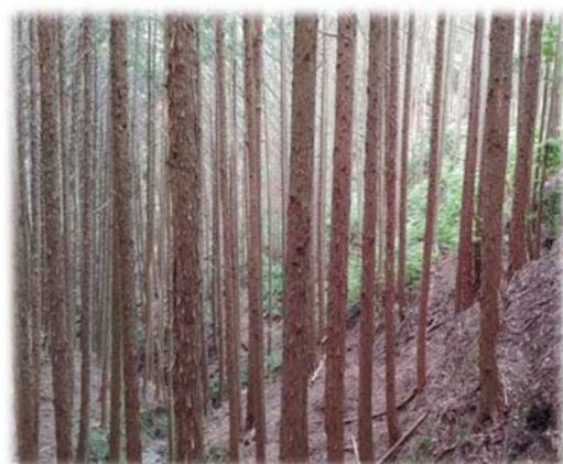
〈手入れのされていない森林のイメージ〉