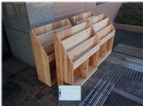
絵本ボックス(保育園、こども園)

町有林の間伐材で作られた木製備品を購入し、役場や学校などの公共施設に設置しました。