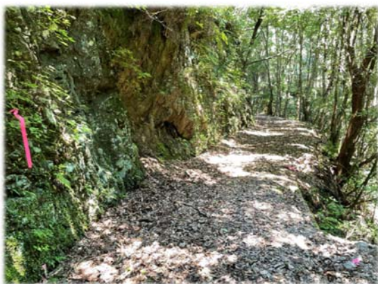
〈幅員が狭くなっている箇所〉