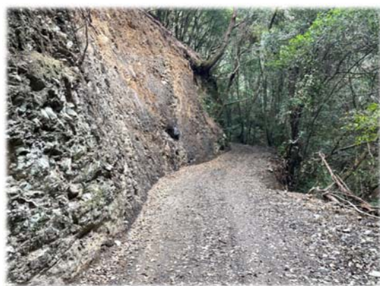
〈道路拡幅のためのり面を掘削〉