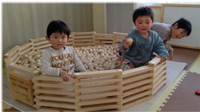
ひのきプール(子育て交流施設)