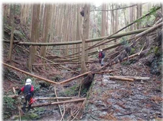
〈林道を倒木の撤去〉