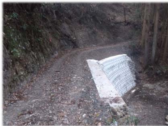
〈コンクリートブロック積みで補修〉