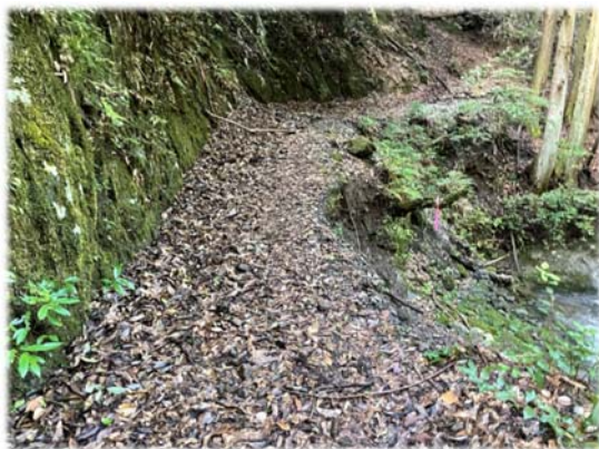
〈路側が崩落した箇所〉