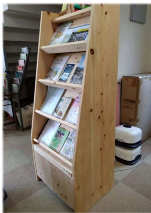
パンフレットラック(役場、学校、公民館)