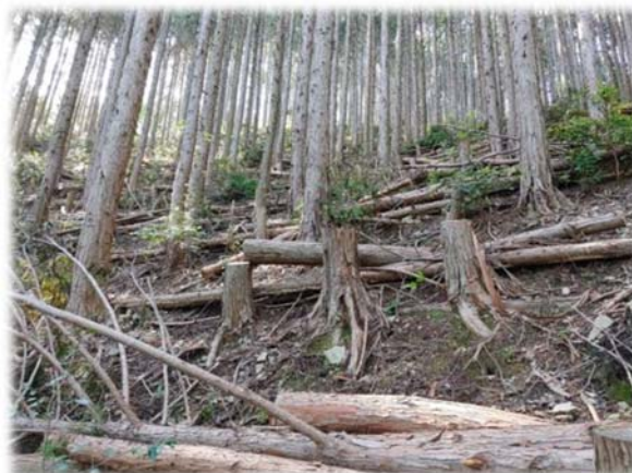
〈間伐実施後の森林〉