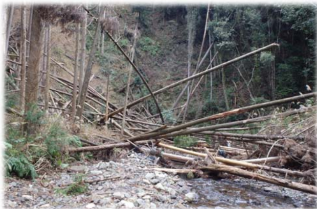
〈河川をふさぐように重なる倒木や流木〉

台風で発生した倒木や流木が河川上に重なり、二次災害の恐れがあったため撤去・処分を実施しました。