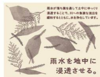
水資源の貯蓄・浄水

また、令和6年度からは森林環境譲与税の財源となる「森林環境税」の課税が始まりました。(国民一人当たり年間 1,000 円)