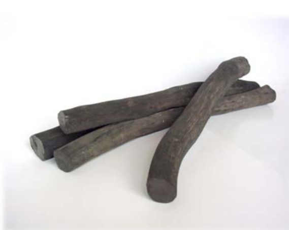
〈みなべ町の特産品「紀州備長炭」〉