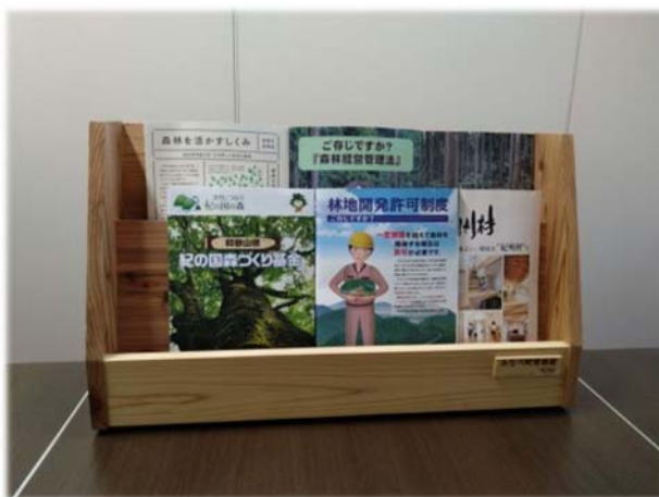
パンフレットラック卓上タイプ(役場)