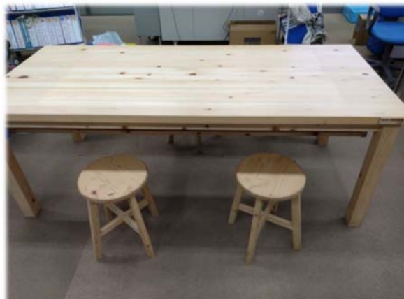
テーブルと丸椅子(役場)