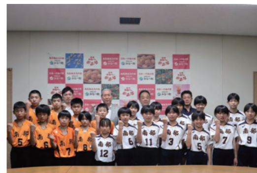
南部バレーボールスポーツ少年団の皆さん

優勝した南部バレーボールスポーツ少年団は、8月7～10日に東京体育館等で開催される全国大会に出場されます。 全国大会での活躍を期待しています！