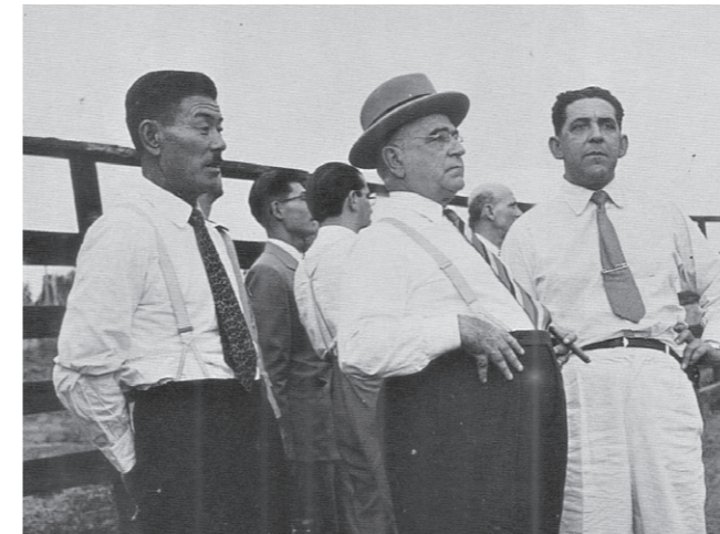
当時のブラジル大統領が松原氏(左)の農園で

戦後日本の窮状打開のためブラジル移民再開に奮闘した男の物語を、ぜひ会場でご覧ください。