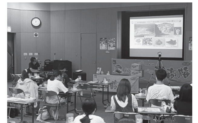
近畿大学学生へ梅システムの講義

これは、JA和歌山県農と近畿大学が、県内の農業を活性化することを目的として2019年3月に包括連携協定を結んだことから今回初めて取組を実施したもので、学生たちはこのほか、町内の農園を訪れ、梅の塩漬けや天日干しの作業を見学し、たくさんの質問を投げかけていました。