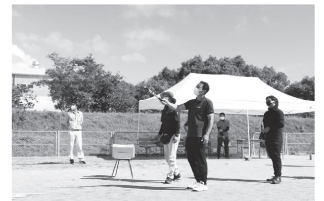
専用ホルダーを手に持ち、花火の実演

参加した農家男性は、「有害鳥獣が多く、梅の収穫時期に実を食べられて困っている。年に1度収穫する大切な農産物を守るために花火が少しでも役に立てば。」との思いから参加され、この日は、(有)紀州煙火(有田川町)による注意事項等の説明のほか、実際に専用のホルダーを手に持ち、実技講習を行いました。