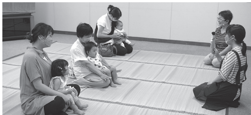
0~3歳児のおはなし会の様子