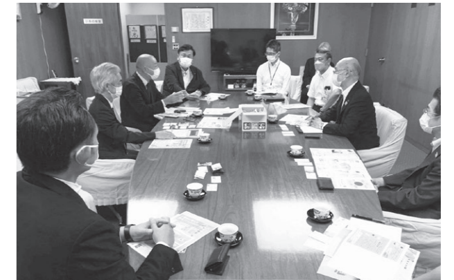
葛飾区長らへ備蓄用梅干しのPR

備蓄用梅干しは、JA紀州が製造する、常温で5年間の保存が可能な塩分約20%の「白干し梅」で、熱中症予防や疲労回復に効果的な梅干しを備蓄用だけでなく、日常的に食べてもらえるよう、今後も首都圏のイベント等でPRしていきます。