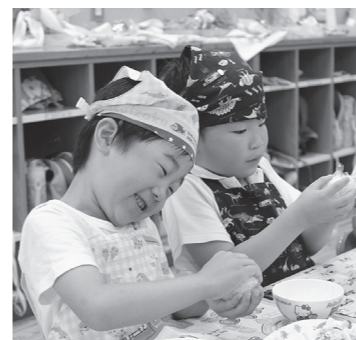
梅干しおにぎりで笑顔の給食（昨年、上南部こども園で）

この条例、宣言を受け、平成28年からは「6月6日の梅の日」に、梅干しおにぎりを食べる「習慣づくり」に取り組んでいます。