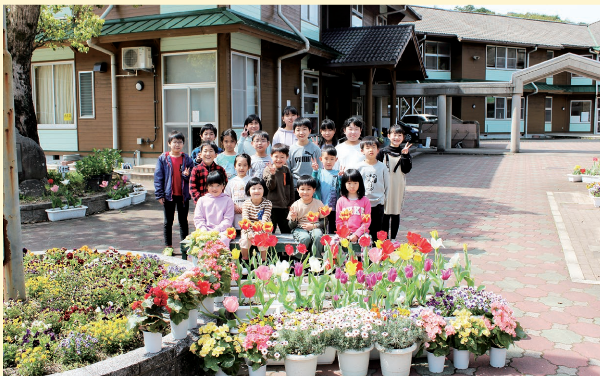
▲ 清川小学校(優秀賞)