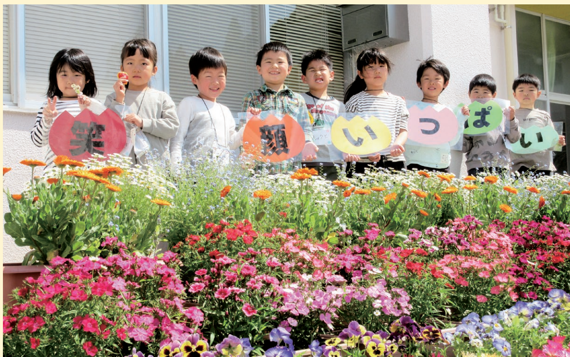
▲ 高城小学校(最優秀賞)

人権の花運動は、次代を担う児童が協力して花を栽培することにより、「思いやりの心」を育ててもらうことを目的に実施されています。