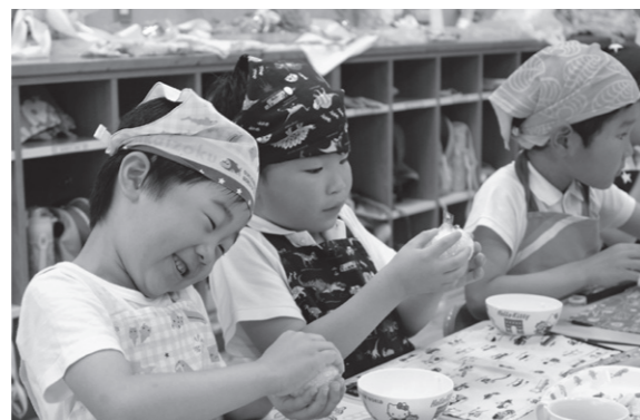
おいしくな〜れ(上南部こども園)