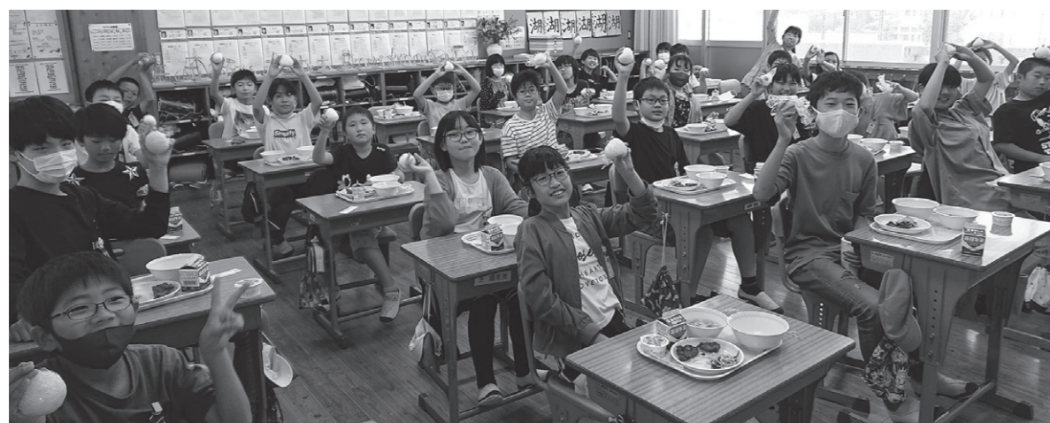
上手に握れたよ〜(南部小学校)