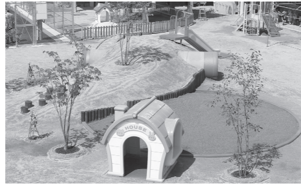
改修された上南部こども園の園庭