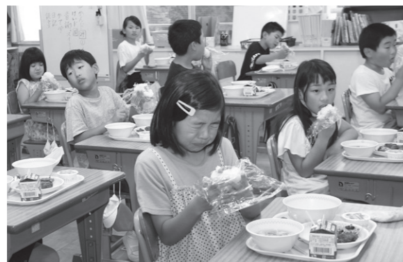
ちょっと、すっぱ〜い(高城小学校)

今年は、6月4日(金)に幼・保・こども園・小中学校の子どもたちが給食で、梅おにぎりを食べました。