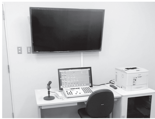
▶操作卓（生涯学習センター）

今回のデジタル化工事では、本体設備は生涯学習センターに整備し、南海トラフ巨大地震での津波により被災が想定される役場庁舎には遠隔操作により放送が行えるように整備しました。