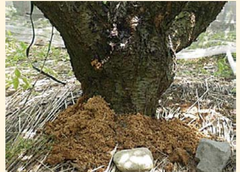
株元に溜まったフラス