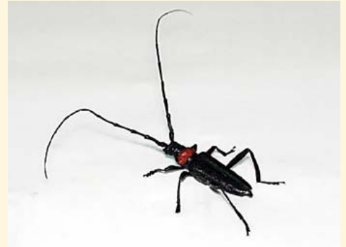
クビアカツヤカミキリ成虫

なお、特定外来生物に指定されていますので、生きたまま持ち運ぶことは法律で禁止されています。