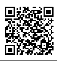
和歌山県防災ナビ QRコード

また、洪水浸水想定区域等も確認できますので、ぜひダウンロードして、ご活用ください。