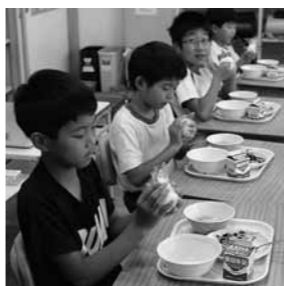
昨年、「梅の日」に高城小学校で

この条例、宣言を受け、平成28年からは「6月6日の梅の日」に、うめぼしおにぎりを食べる「習慣づくり」に取り組んでいます。