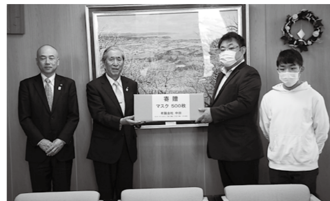
有限会社 中田 様