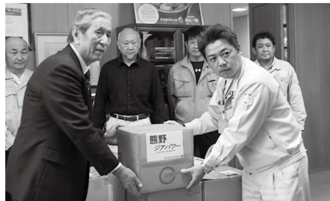
みなべ町建設業組合 様