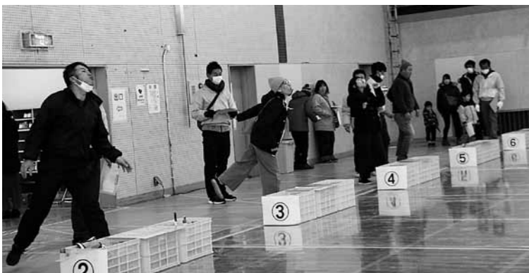
▶梅の種を飛ばす参加者