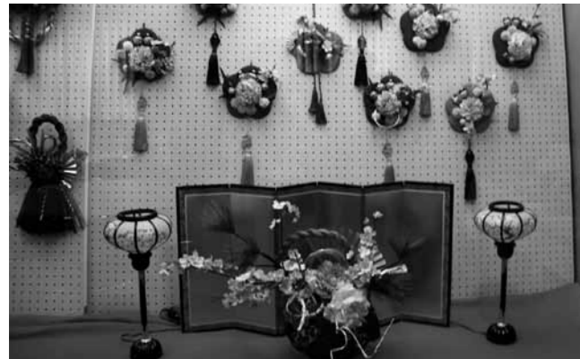
▲フラワーアレンジメントコーナー(南部公民館)

また、11月3日~4日は高城公民館で「秋の文化展・菊花展」、清川公民館で「清川地区文化展」が開催されました。