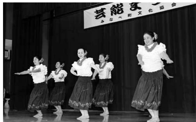
▲フラダンス(芸能まつり)