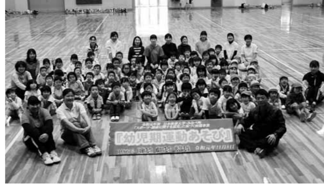
この交流事業は、日本体育大学と町で締結した「スポーツ・健康に関する協定」により、実施しました。

前日7日には保健福祉センターで、職員を対象に「心と体を育てる運動的な遊びを考える」をテーマに、講義等をしていただきました。