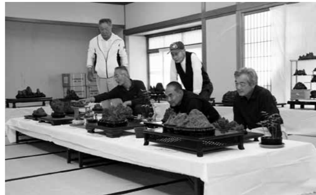
▲瓜溪石展示コーナー(生涯学習センター)