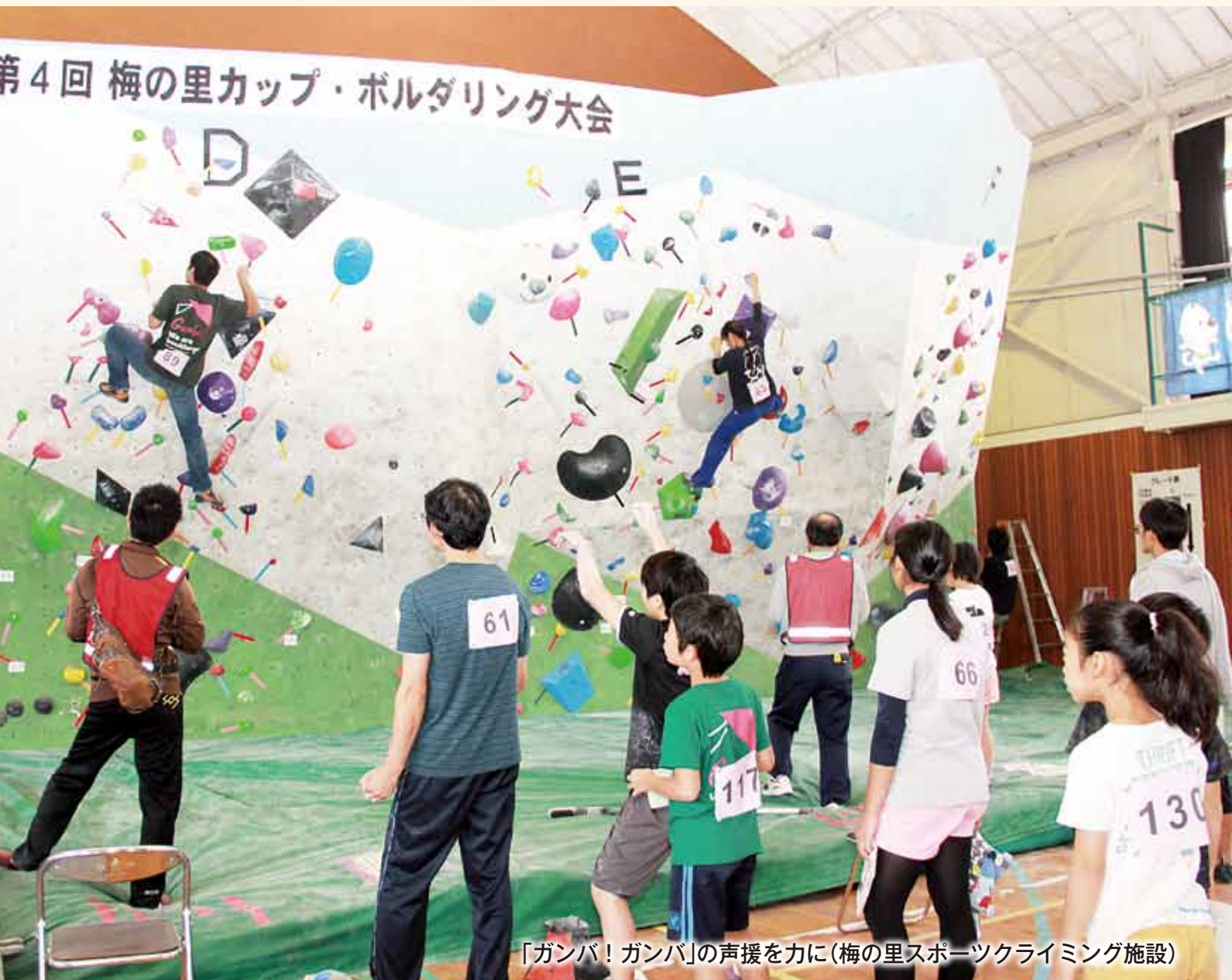
「ガンバ！ガンバ」の声援を力に(梅の里スポーツクライミング施設)