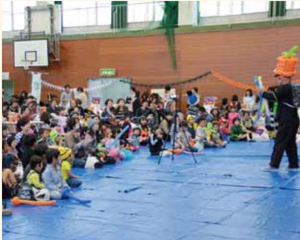
体育館内は多くの参加者で賑わう