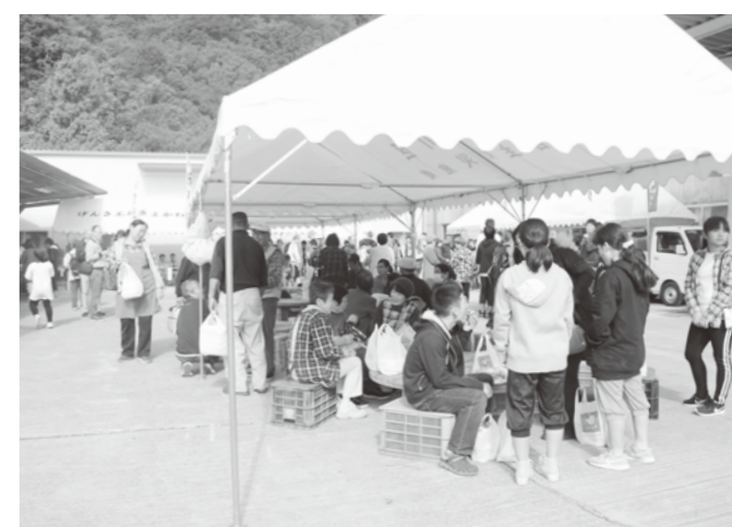
地域の皆さんと選手が交流