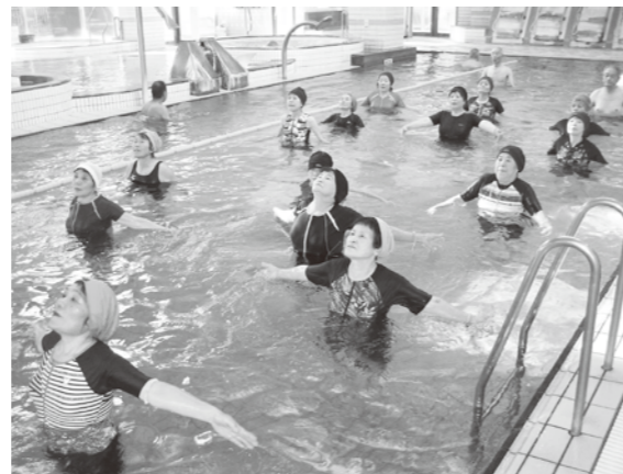
定員は24名です。 (希望者多数の場合は優先度で判断します。)