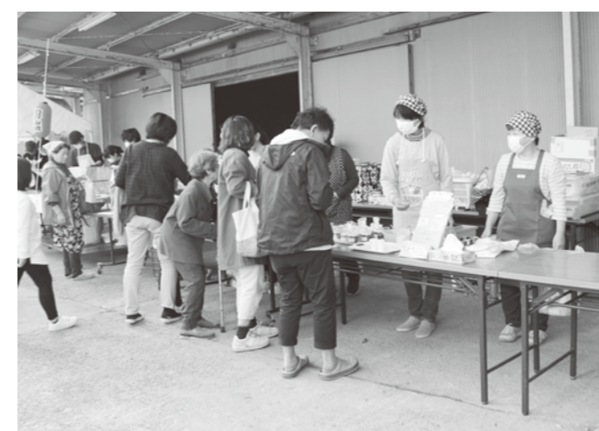
梅ジャム販売コーナーで