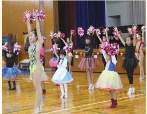
みなべ新体操クラブによる演技