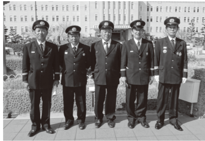
表彰式に出席された皆さん