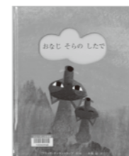
おなじそらのしたで ブリッタ・テグゼントラップ 作絵 (ひさかたチャイルド)