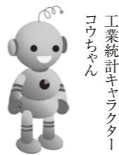
工業統計キャラクター コウちゃん

お問い合わせ先 和歌山県調査統計課 (Tel.073-441-2390)・町役場 (Tel.72-2051)