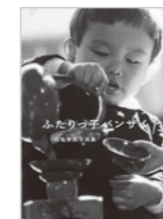
ふたりつ子バンザイ 石亀泰郎 著 (夏葉社)