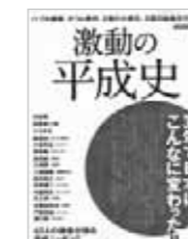
激動の平成史 (洋泉社)