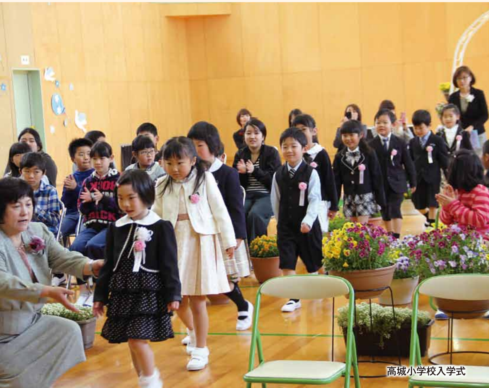
高城小学校入学式