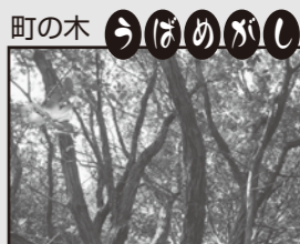
町の木 うはめがし