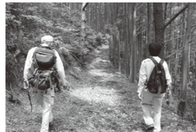
コース視察の様子

コース周辺の皆さまにはご迷惑をおかけしますが、ご理解とご協力をお願いいたします。