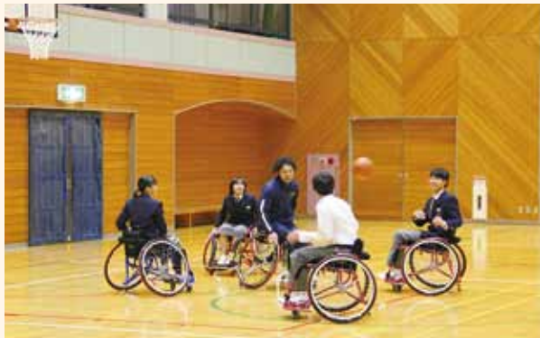
中学生と一緒に車いすバスケットボールを楽しむ