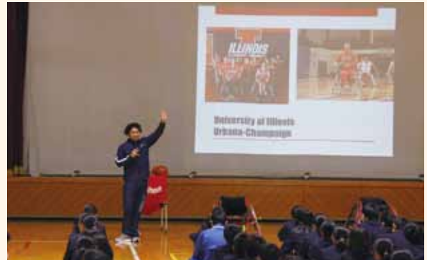
アメリカ留学のことなどを中学生に説明