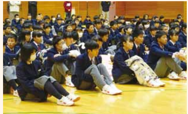
熱心に話を聞く中学生