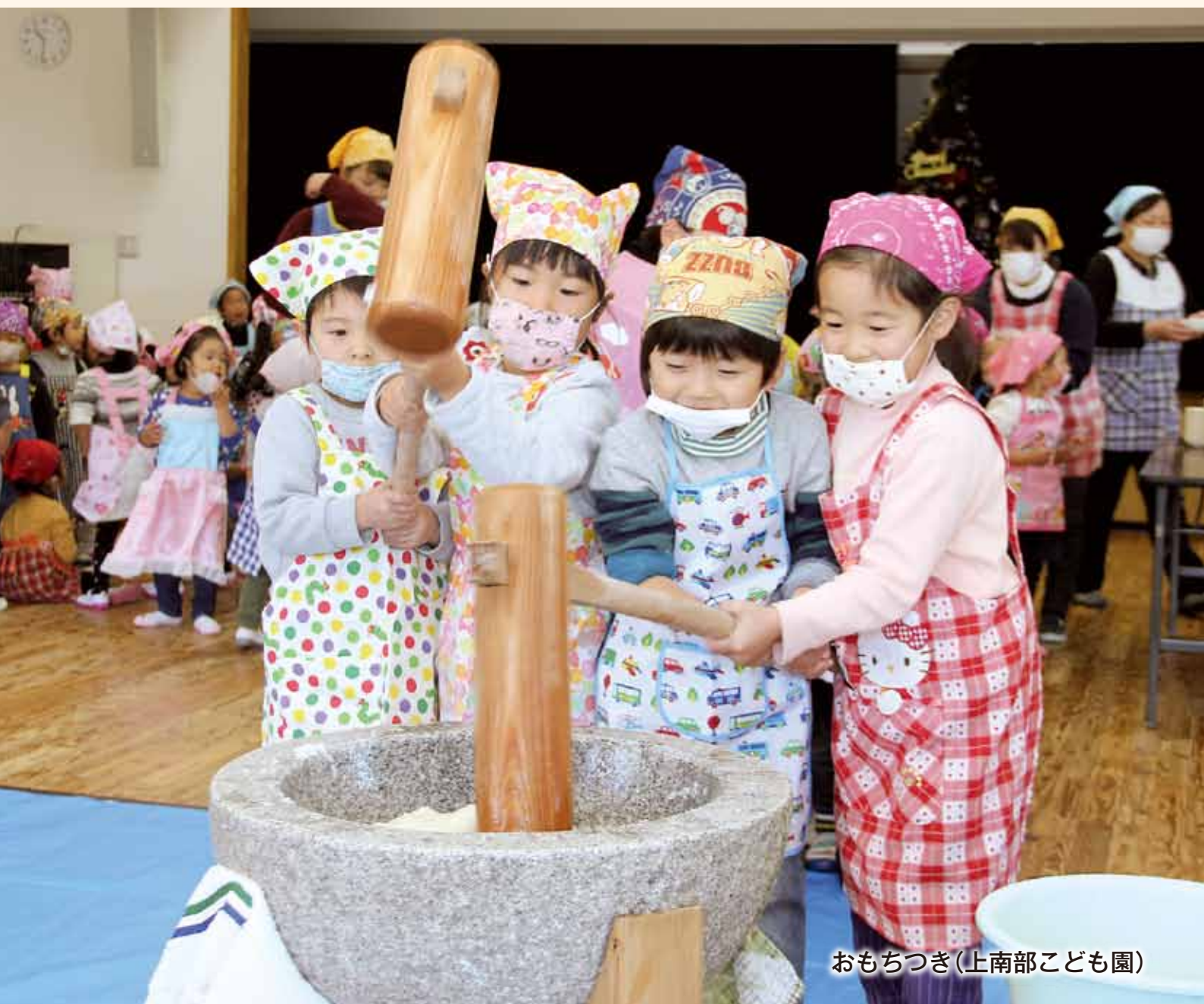
おもちつき(上南部こども園)