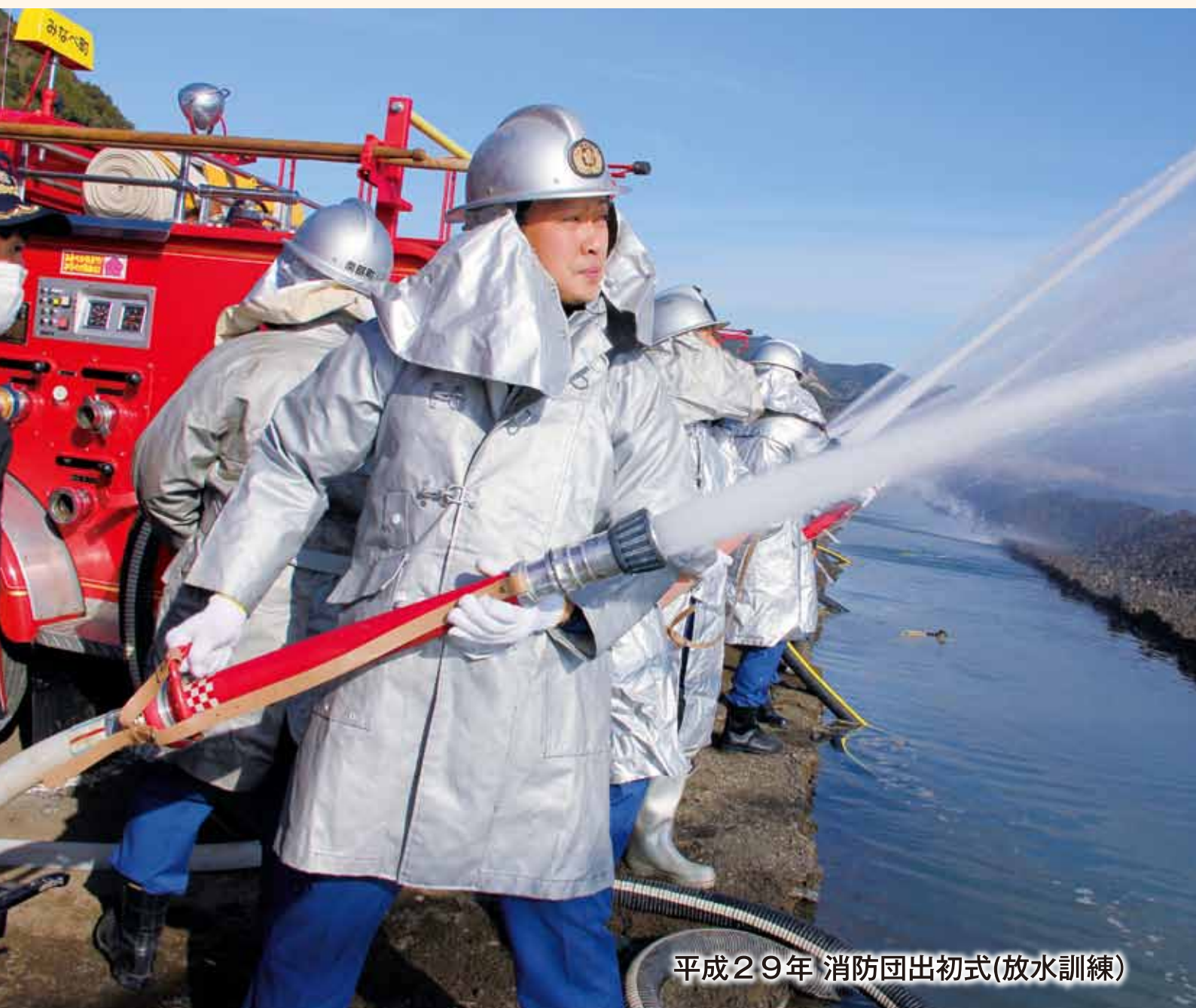
平成29年 消防団出初式(放水訓練)