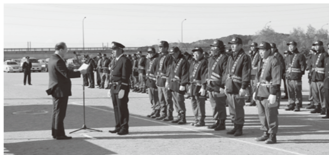
20年表彰された皆さん