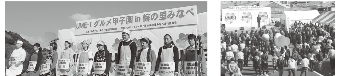
▲昨年の出場チーム