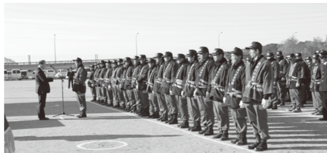
10年表彰された皆さん