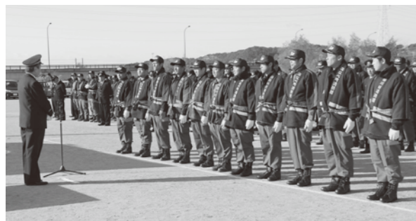
新入団員のみなさん