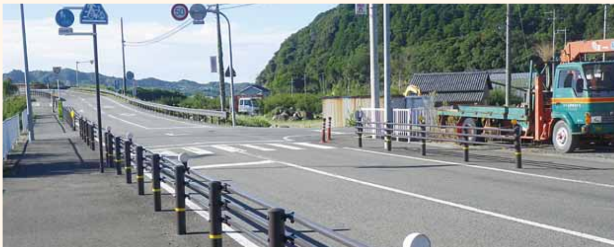
▲西本庄駐在所近くの横断歩道