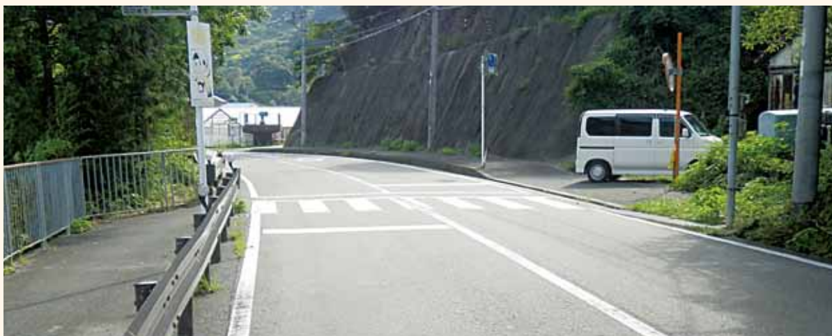
▲国道424号辺川地内の横断歩道