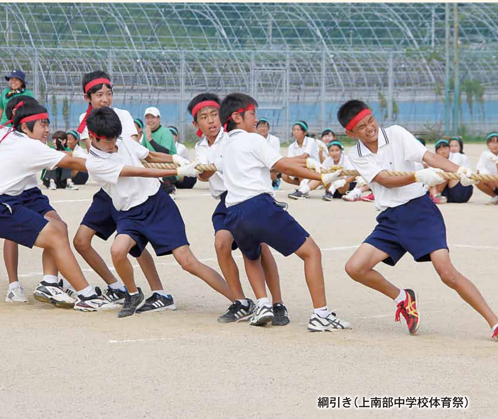
綱引き(上南部中学校体育祭)