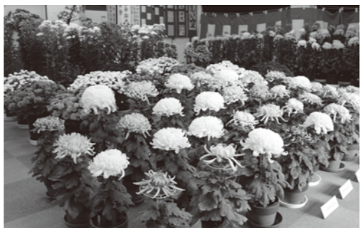
昨年の高城文化展・菊花展