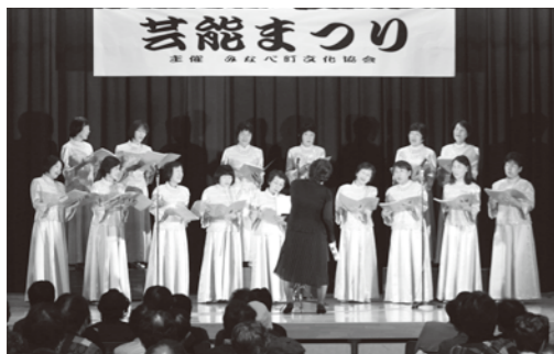
昨年のコーラスの様子