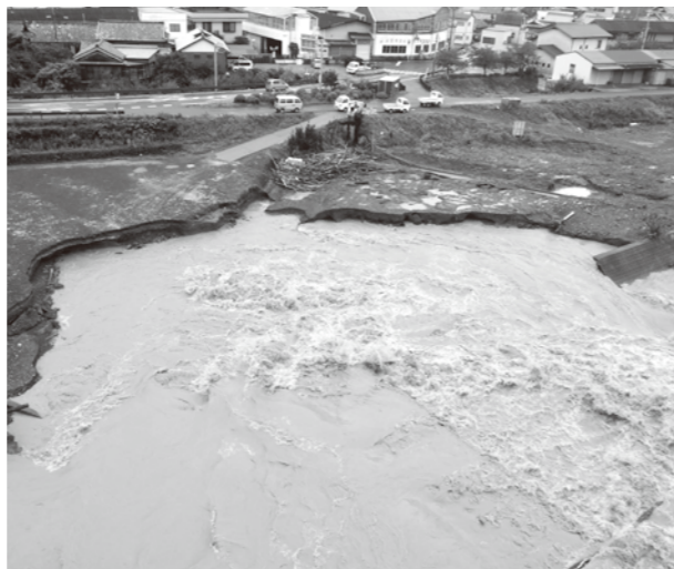
H23 台風12号 学校橋下流 左岸(筋)

なお、みなべ町では、早めの避難を呼びかける時には、清川公民館、高城公民館、生涯学習センター(中央公民館)、岩代小学校、南部公民館の5つの避難所を開設できるように努めています。