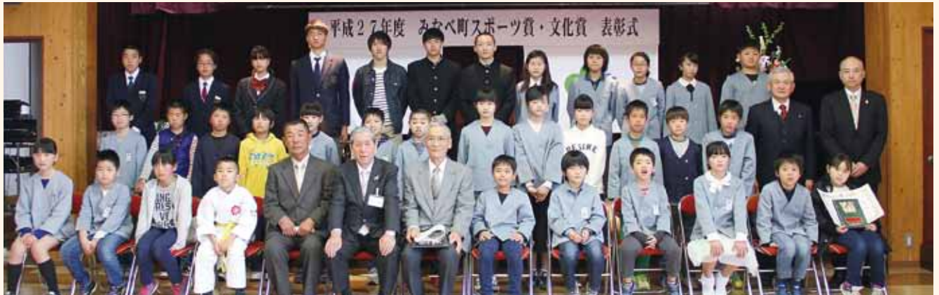
スポーツ賞を受賞された皆さん