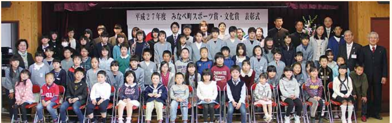
文化賞を受賞された皆さん