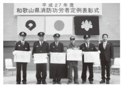
表彰式に出席された皆さん