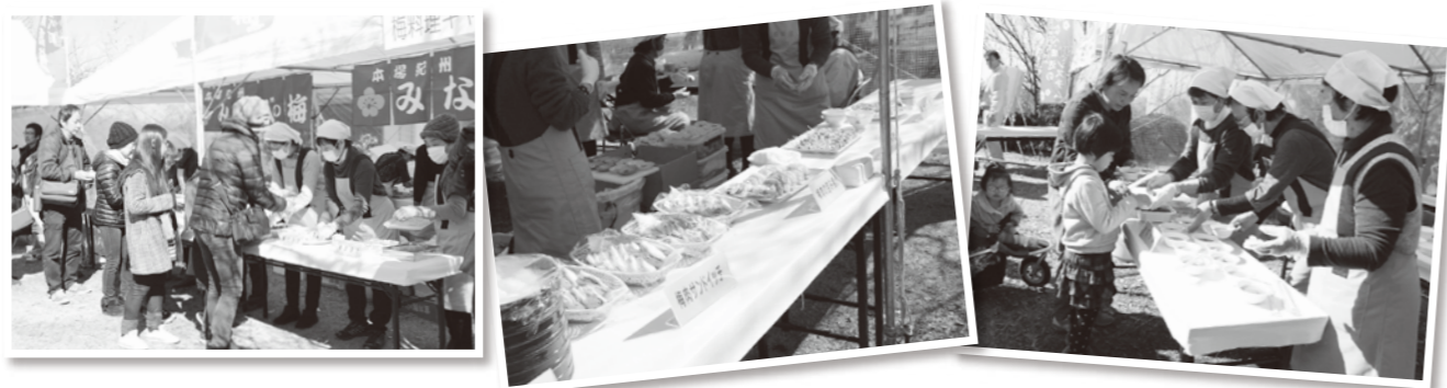
梅料理の人気は絶大でした