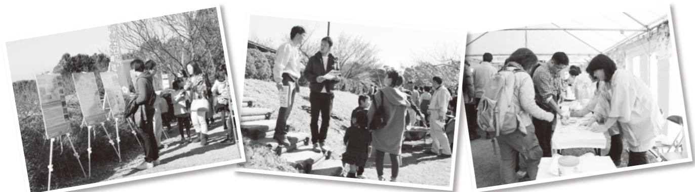
世界農業遺産の説明に興味津々