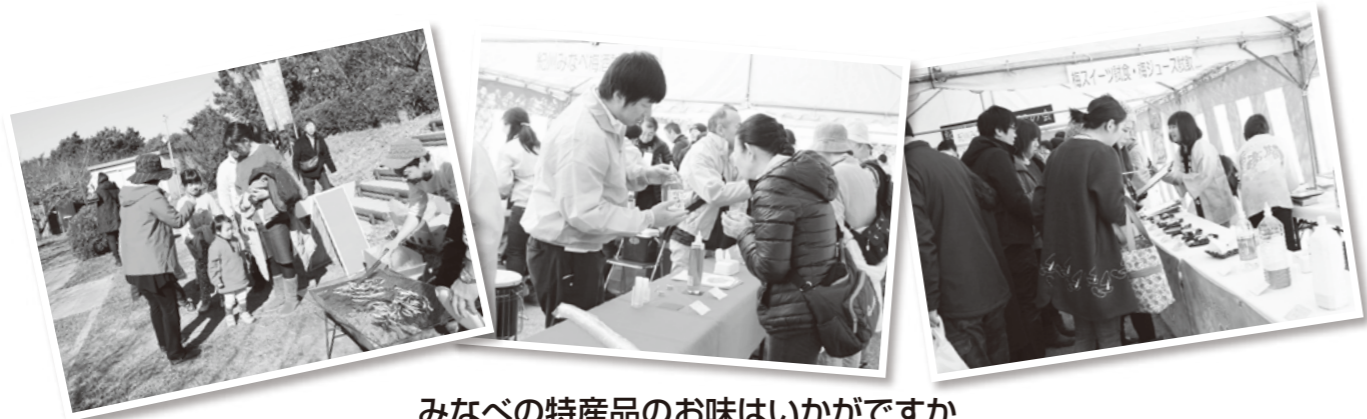
みなべの特産品のお味はいかがですか

また園内では昨年世界農業遺産に認定された「みなべ・田辺の梅システム」についての説明看板の展示やパンフレットが配布され、観梅客も興味深く、説明を聞いていました。