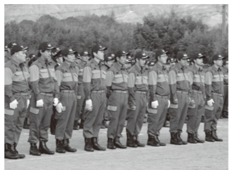
新入団員のみなさん