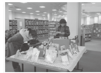
昨年のポップ大賞展の様子

2月6日(土)~14日(日) ゆめよみ館1階展示コーナー 今年も紀南六高校の学校図書館から、ポップ、バルーンアート、レジックアクセサリー、図書館通信の力作が並びます。本から広がる豊かな世界をお楽しみ下さい。