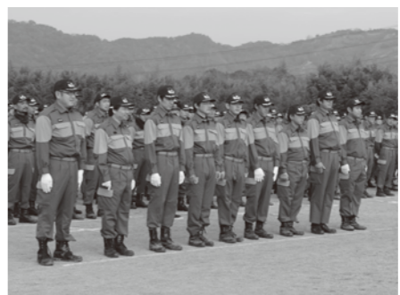
10年表彰のみなさん