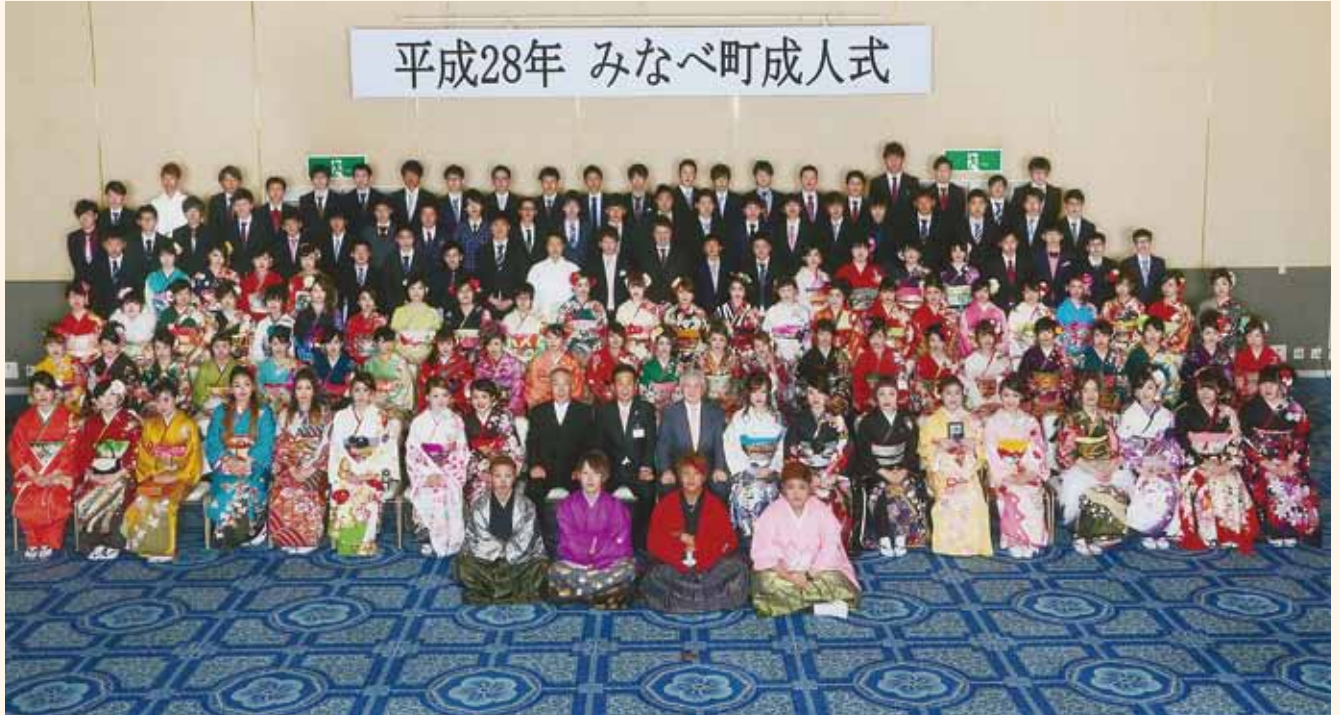
成人式に出席されたみなさん