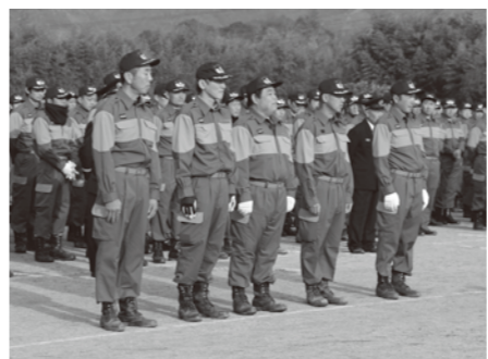
20年表彰のみなさん