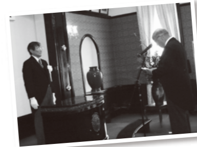
県庁で行われた伝達式で、受章者を代表して御礼の言葉を述べられました