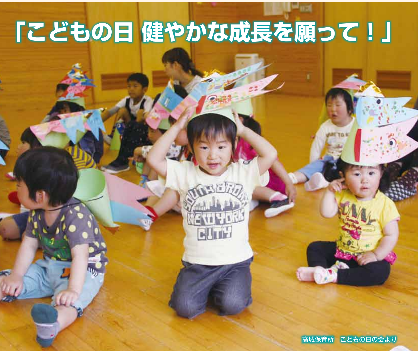
高城保育所 こどもの日の会より