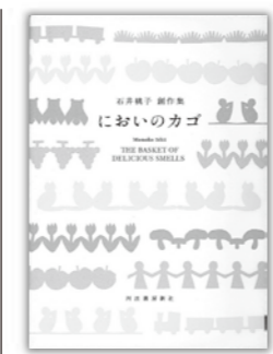
「においのカゴ」 石井桃子 河出書房新社