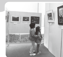
昨年度写真展の様子

みなべや名所地の風景・自然などを切り取った素敵な写真を展示します。ぜひご覧ください。