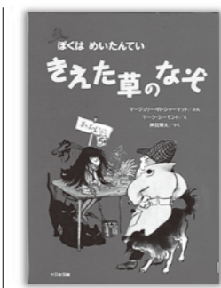
「きえた草のなぞ」 マイショリー W シヤーマット 文大日本図書

すさんだ町でスリをして生きていた少女が、ある日、おばあさんのカバンをひったくろうとします。おばあさんは「やくそくするならね」とカバンを渡してくれました。中に入っていたのはたぐさんのドングリ。その日から、少女も、町も、ゆっくりと変わりはじめます。大人の心にも響く絵本です。