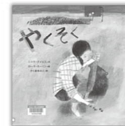
「やくそく」 ローラカリン 絵(日)出版