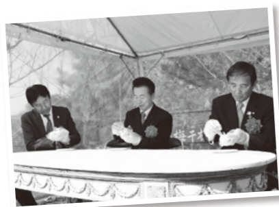
出来ばえはいかが？

今年は、梅干しおにぎり条例にちなみ、梅干しおにぎりリレーが町内4箇所で開催され、スタートの南部梅林の会場では、県知事や県議会議長、日高振興局長も参加しておにぎりを握ってくれました。