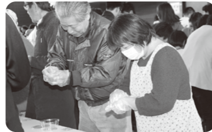
丸いおにぎりできるかな？