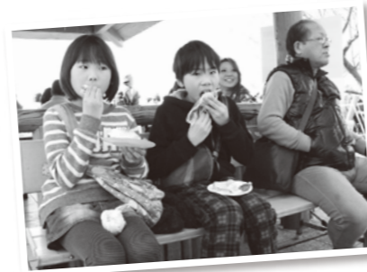
梅おにぎりも、梅サンドもおいしい