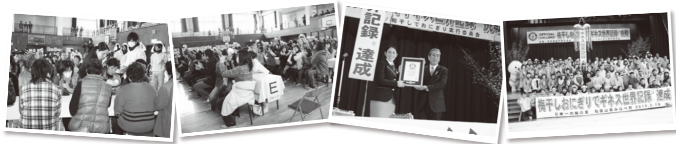
審査の時はドキドキ