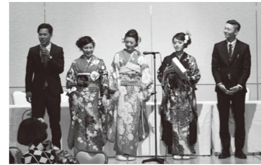
実行委員の皆さん