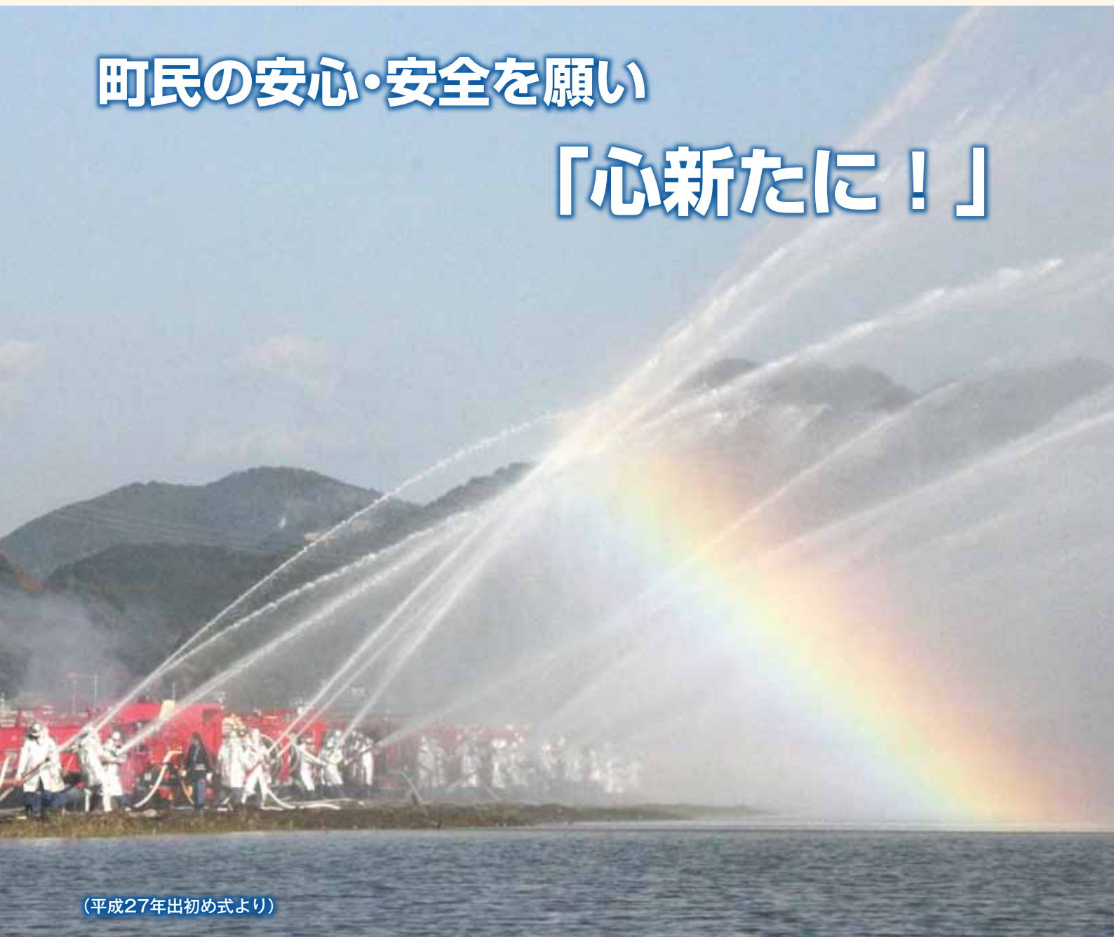
(平成27年出初め式より)