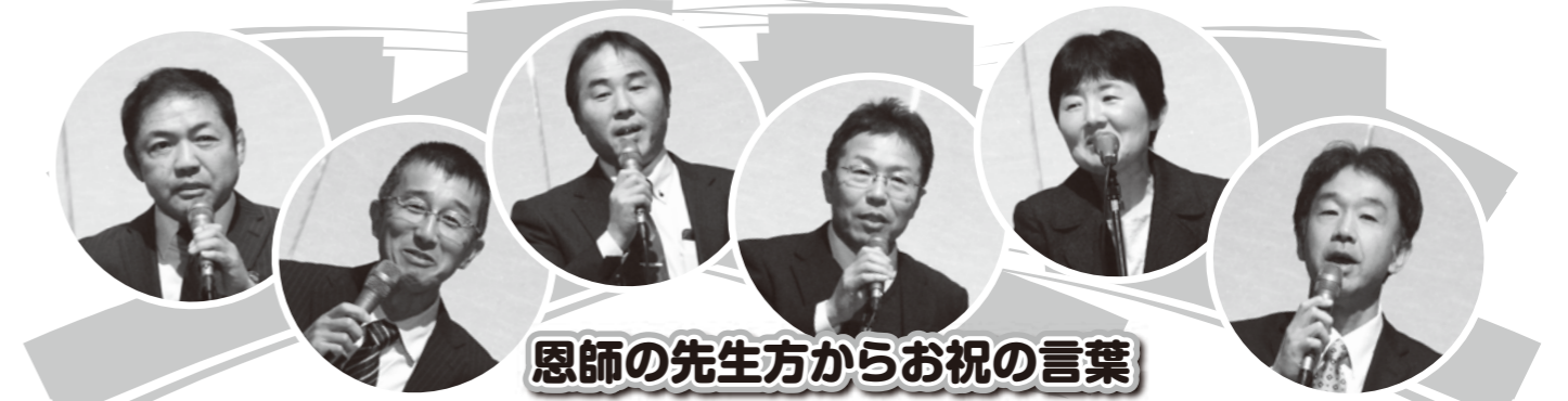
恩師の先生方からお祝の言葉