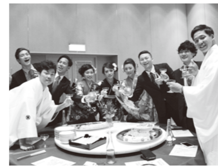
出席された新成人の皆さん