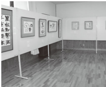
生涯学習センター