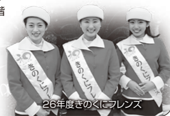
26年度きのくにフレンズ

募集内容等くわしくは、(公社)和歌 山県観光連盟 キャンペーンスタッ フ係(Tel073-441-2776)まで お問い合わせください。