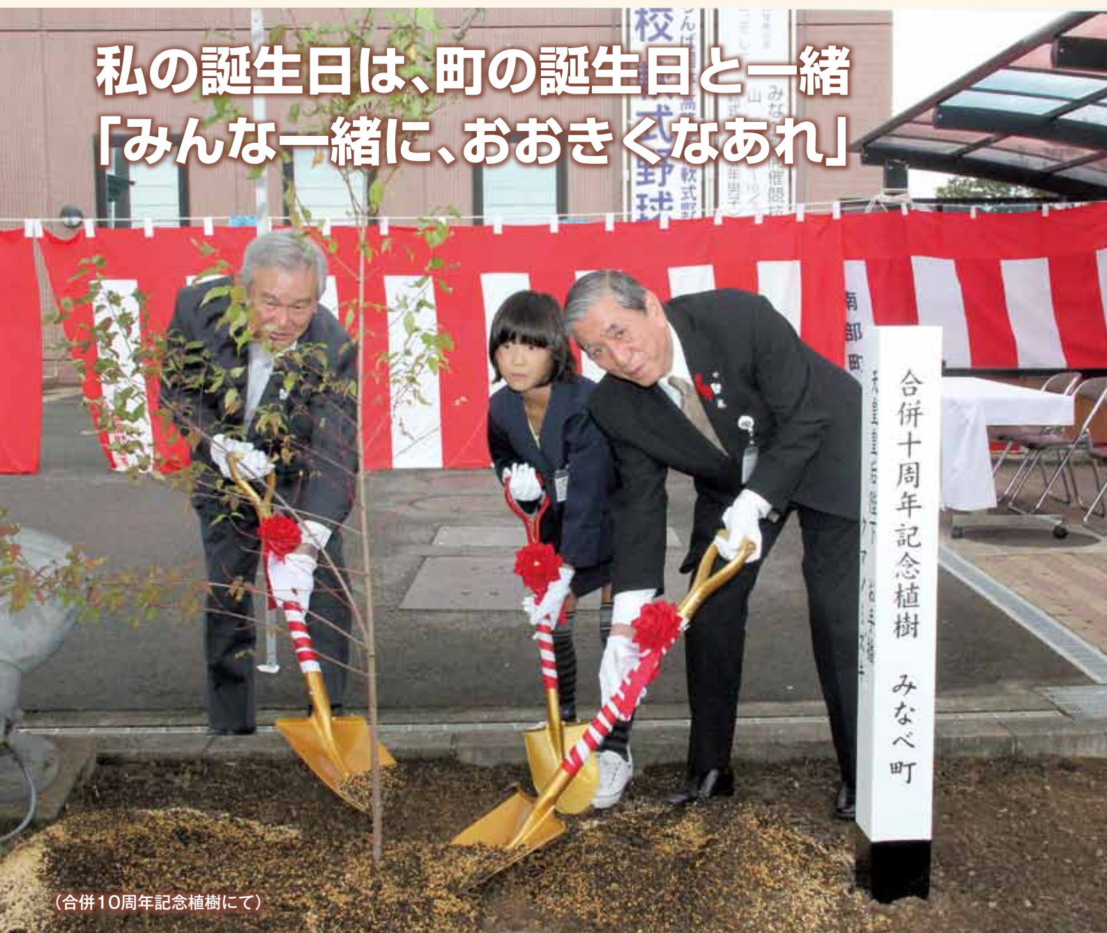
(合併10周年記念植樹にて)