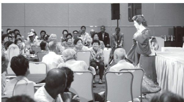
昨年の長寿のつどいの様子