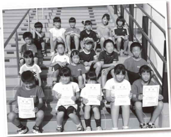
みなべACの子どもたち