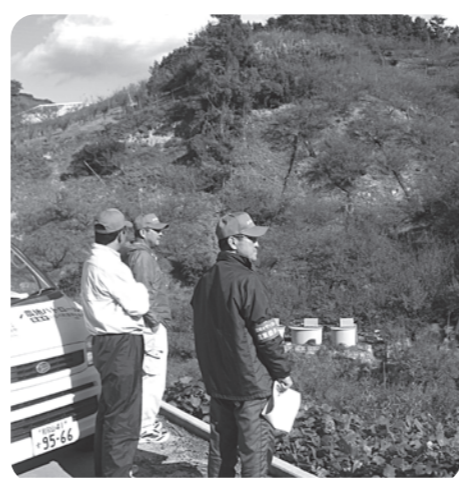
※昨年の農地パトロールの様子

優良農地の確保と有効利用の促進を図るため、毎年1回、農地法の規定により町内全域の農地の利用状況調査のため「農地パトロール」を実施しています。和歌山県では平成23年度から「新・さらさら物農地活用キャンペーン」に取り組み、これまでの活動に検証を加えながら、耕作放棄地の発生防止と解消などに向けて強化運動を展開しています。しかし、町内の耕作放棄地は昨年の調査で約14ヘクタールが確認されています。今後も地域の实情に即した取り組みを行い、農業委員会の十分な役割や使命を発揮し、耕作放棄地解消に努めていきます。