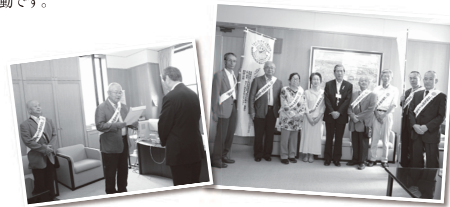
田辺保護司会みなべ分会のみなさん

「社会を明るくする運動」は、すべての国民が、犯罪や非行の防止と、犯罪をした人や非行のある少年の更生について理解を深め、それぞれの立場において力を合わせ、犯罪や非行のない安全で安心な地域社会を築こうとする全国的な運動です。