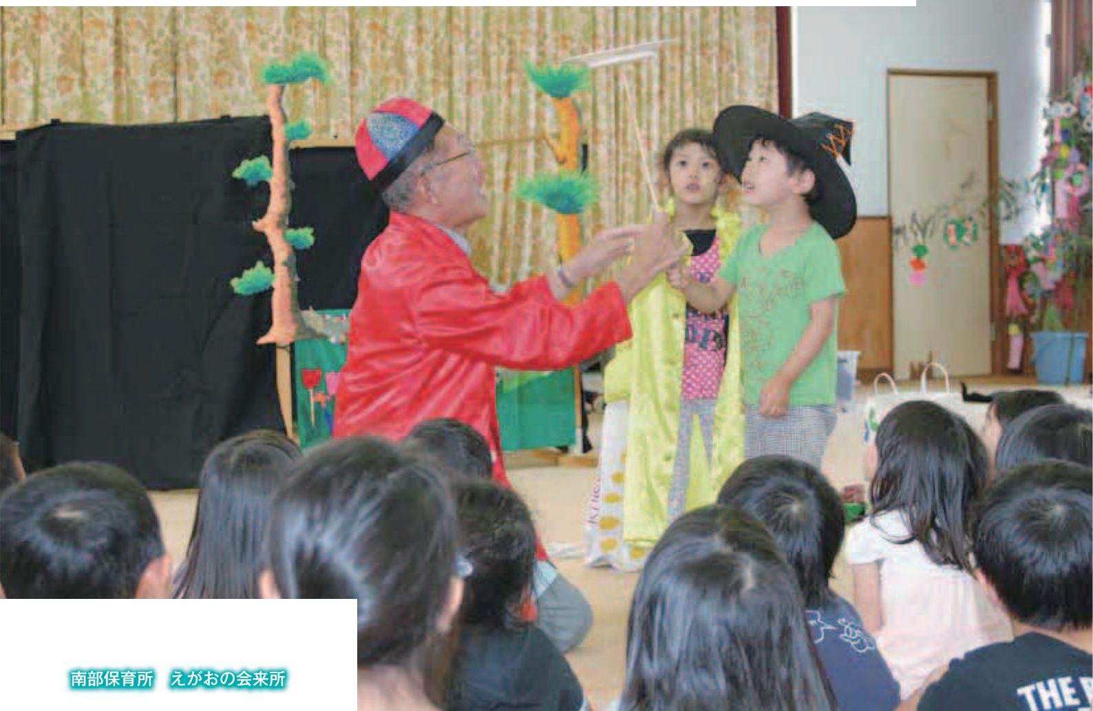
南部保育所 えがおの会来所