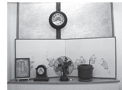
※前回のミュージアムの様子

●申し込み方法 氏名、住所、電話番号、ご提供品名及びご提供品についての説明をご記入の上、電話、FAX、メールによりお申し込みください。 *FAXまたはメールで申し