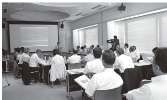
設立総会の後、研修会を実施

世界農業遺産は、社会的・経済的・生態学的な変化に適応しながら、進化を続けている「生きている遺産」、「未来への遺産」であり、登録による農法等の制限はありません。