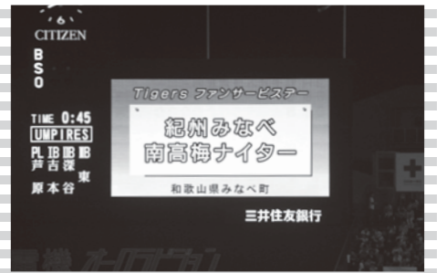
オーロラビジョンでみなべ町を紹介