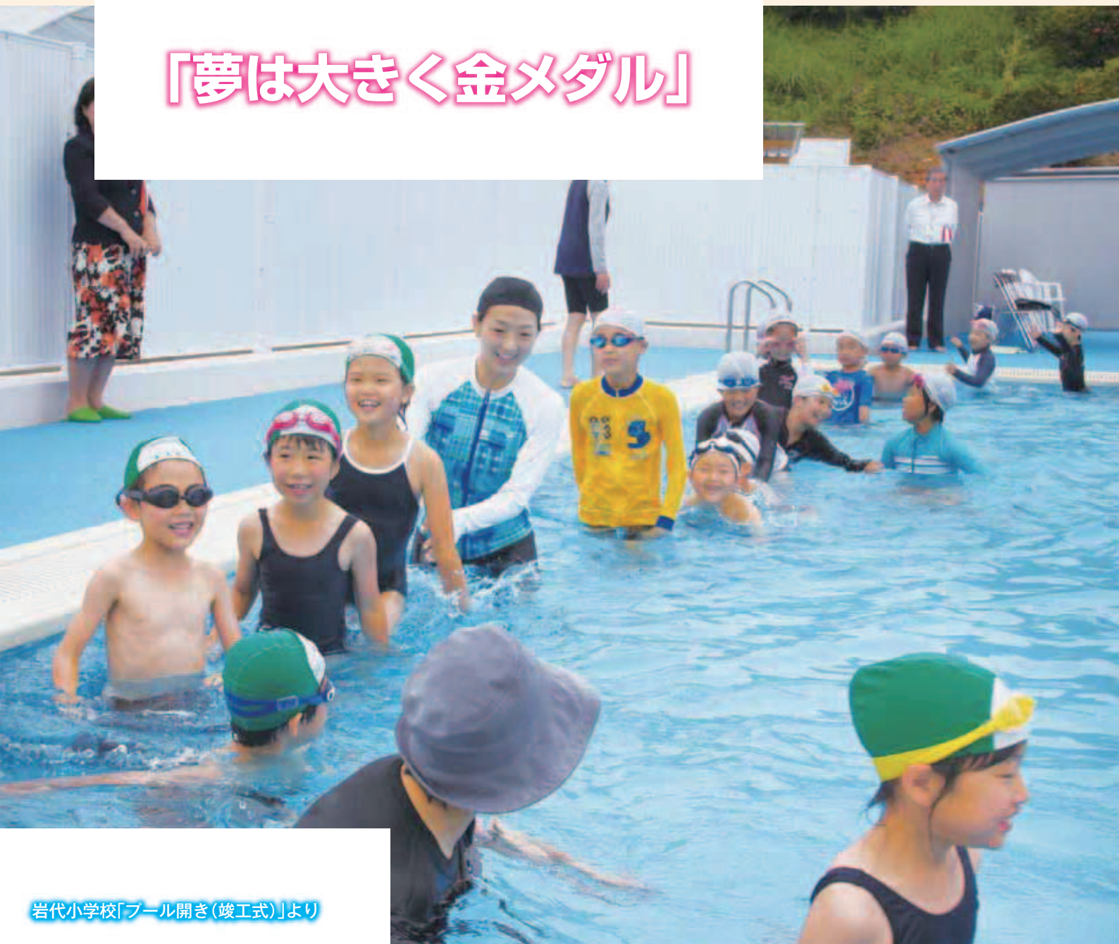
岩代小学校「プール開き(竣工式)」より