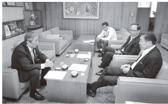
区長などに備蓄用梅干をPR

梅干は農林水産省が作った家庭用食料品備蓄ガイドで「副菜」として取り上げられており、6月11日に開かれた第18回梅振興議員連盟総会で採択された決議案でも「梅干は長期保存が可能で、災害発生時の食料として、食中毒予防や疲労回復、熱中症予防など優れた特長を有しており、家庭や自治体、省庁での食料備蓄に梅干を加えるよう推進に努めること」という項目が新たに加えられました。