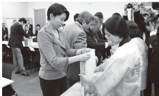
梅議員連盟総会では梅酒づくりも

みなべ・田辺地域は、日本の梅生産を誇る地域です。この地域は、元来農耕に適さない礫質で急峻な里山を活用し、地元の人々の知恵と工夫により約400年に及ぶ梅栽培が継続されてきた歴史があります。その中で、様々な梅栽培の工夫が考え出され、その生産活動を通じて、多様な文化の形成や、里山本来が有する生態系が保存されてきているとともに、農業の多様性も育まれてきました。