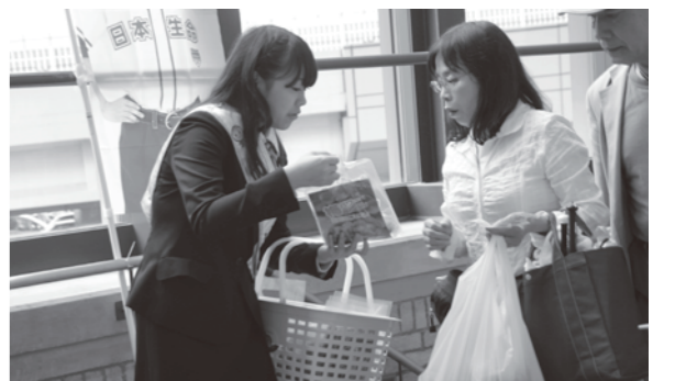
来場者にみなべの梅をPR