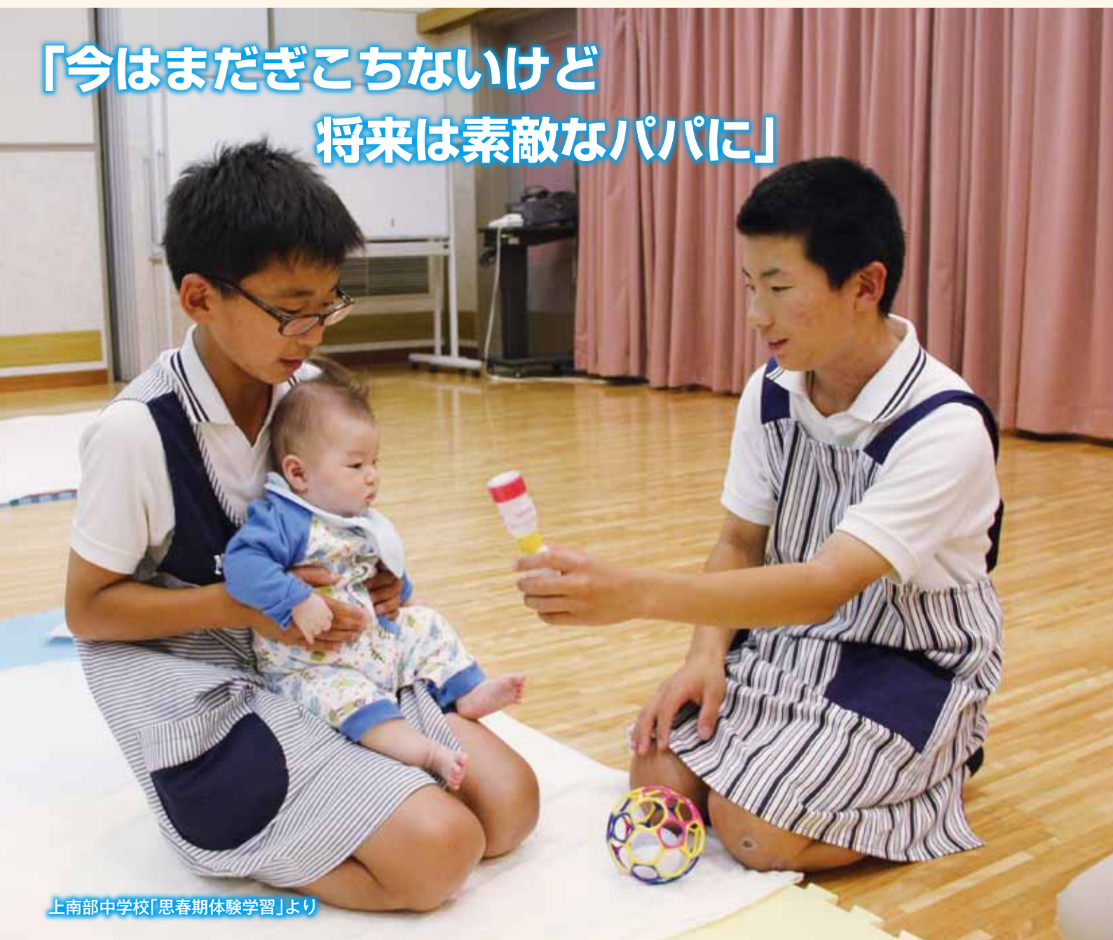
上南部中学校「思春期体験学習」より