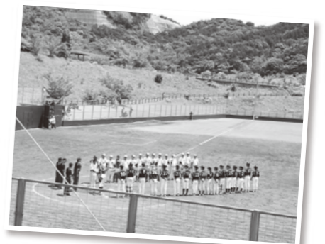
各県の代表チームが出場