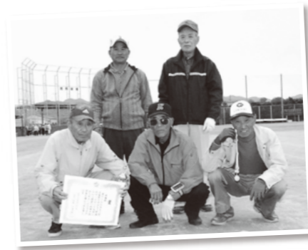
準優勝 梅里チーム