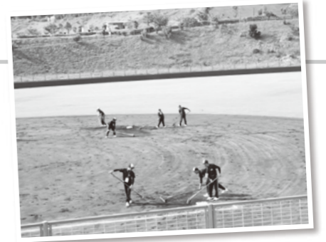
グラウンドを整備する南高生

5月16日～19日にかけて、上富田スポーツセンター野球場ほか3会場で、第36回西日本軟式野球大会(1部)が開催されました。この大会は、2015年開催のわかやま国体軟式野球競技リハーサル大会として、国体の軟式野球の会場となる市町が大会運営を行い、みなべ町も17日(土)に御坊市民野球場で行われた試合で、南部高校の生徒や町内のボランティアの方、町職員が参加し、本番に備えてリハーサルを行いました。