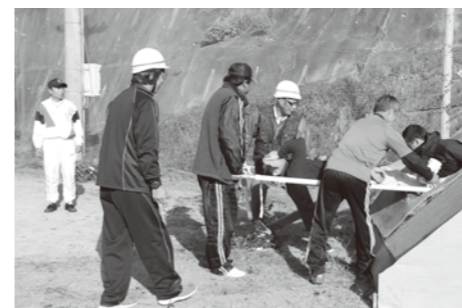
畑地区では救出訓練も

大地震を想定して、地震発生後に地域住民が各防災拠点に参集し、安否確認を行い、消防団が中心となつて、無線による人数確認等の情報伝達訓練を行いました。また、防災訓練に関するアンケートも実施し、訓練に対する意見や感想などを聞きました。南部・岩代・上南部地区は、和歌山県が公表した津波浸水想定を考慮して、浸水域外の高台または浸水域内の避難可能な建物に避難する訓練を行いました。訓練では、津波避難訓練に関するアンケートを行い、避難開始時間や避難方法(手段)、今後有効と思われる避難場所などを調査しました。また、南部小学校6年生の児童はスタッフとして、各観察場所で避難方法や避難時間など避難訓練の様子を観察し、気づきメモノートに記録しました。訓練後には記録した内容を整理し、津波避難の問題点などの観察結果を各グループで発表しました。