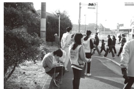
児童が避難訓練を観察