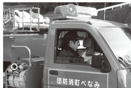
無線による情報伝達訓練