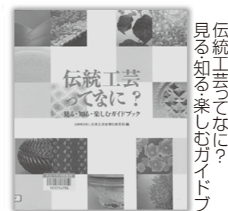
日本工芸会東日本支部 編