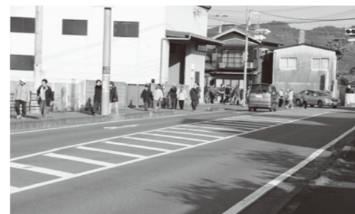
サイレンを聞いてより高台へ避難

して「地震防災の学び」をテーマに、炊き出し訓練や初期消火、起震車体験、防災教室など様々な訓練(体験)を行いました。高城地区は、南海トラフ巨