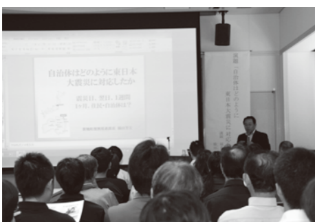
防災研修会の様子

課長を招いて、町職員、議会議員、消防団員や自主防災会の役員を対象に「自治体はどのような対応に「自衛体はどのように対応」をテーマに、研修会を行いました。講演では、被災後の捜索・救助活動やライフラインの復旧、避難所・仮設住宅の状況、職員の行動などについて、経過をお話され、その中で気付かされたことや新地町の復興対策について教えて頂きました。