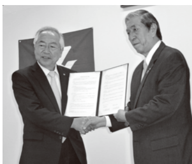
調印後握手をかわす両町長