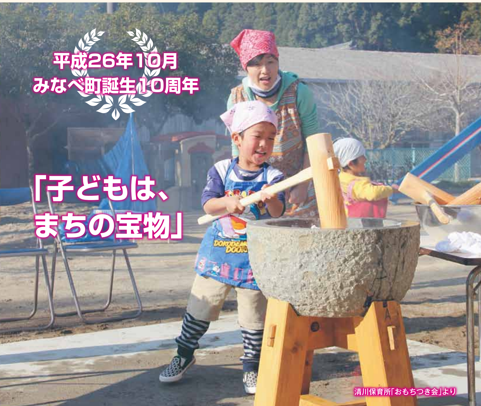
清川保育所「おもちつき会」より