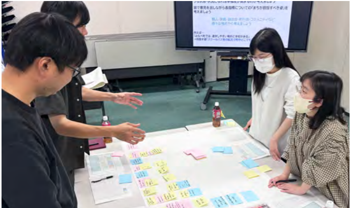
意見を出しながら「まちが目指すべき姿」を考える

5月10日、「まちへの想い」まちの未来”を考えるみなべ町まちづくりワークショップを行いました。 町内に在住する18歳～39歳の方が参加し、みなべ町の地域幸福度指標で特に重要だと思ふ指標を決め、まちが具体的にどのような状態、状況になれば幸福度が上がるのかを考えました。