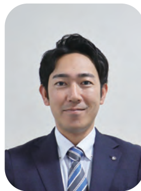
みなべ町長 山本 秀平