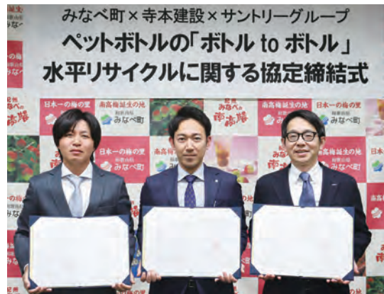
左から寺本さん、町長、関さん(サントリーグループから代表)