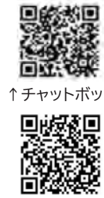
↑チャットボット ↑タックスアンサー

ただけない場合は、地方税法第 354条の2の規定に基づき、 税務署で国税資料の閲覧をさせ ていただきます。