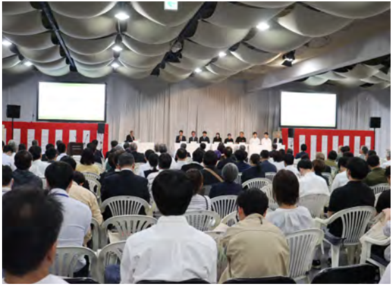
パネルディスカッションの様子

世界農業遺産 認定10周年式典を開催 10月17日、世界農業遺産「みなべ・田辺の梅システム」認定10周年を記念した式典とシンポジウムがガーデンホテルハナヨで行われました。 オープニングには、アトラクションとして和歌山県指定無形民俗文化財の「名之内の獅子舞」が披露され、基調講演や地域の取組展示、新たな取組事例の紹介、地元の農家や高校生を交えたパネルディスカッションが行われました。