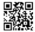
確定申告書等 作成コーナー

成コーナー」からマイナ ン バーカードを利用した自宅等 e-Tax申告のご利用をお 願ひします。