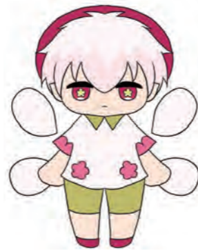
梅星 クイナ (うめぼし くいな)