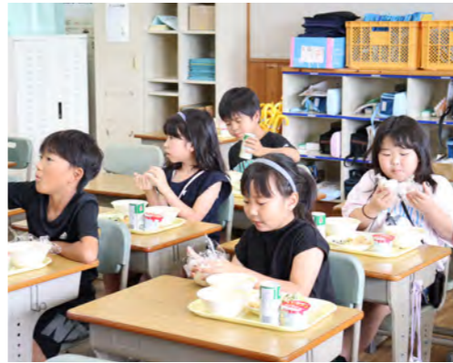
給食で梅干おにぎり（上南部小学校）

6月6日「梅の日」に、今年も町内の子ども園や各小中学校で、給食の時間に自分で梅干おにぎりを作って食べました。 梅干は町内の農業団体でつくる「みなべアグリ」から提供を受け、米は「日本の食文化推進連携協定」を結ぶ新潟県南魚沼市から提供された南魚沼産コシヒカリを使用しました。