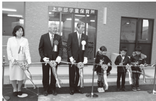
入所者3人も代表で

いただいたける施設を整備することにより、安心して子育てができると共に少しでも町の子どもたちが増えることを願っています。