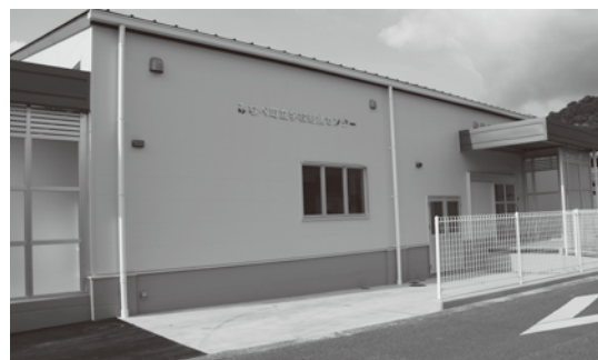
増設された給食センター