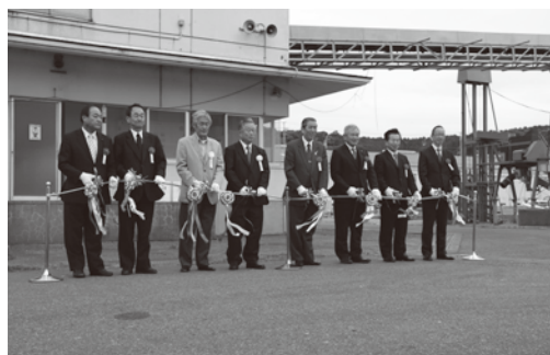
施設の完成を祝って

大漁時の対応など、この地にあつた販売体制が確立できるよう研究し、さらなる所得の向上をめざして行きます。