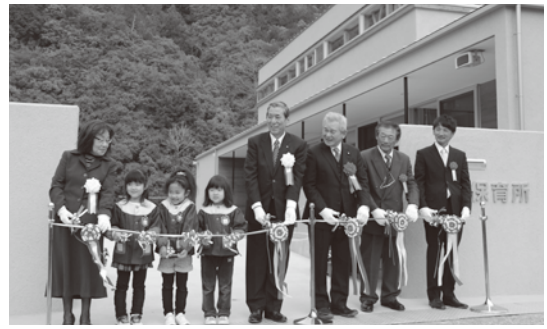
年長組の3人も参加して