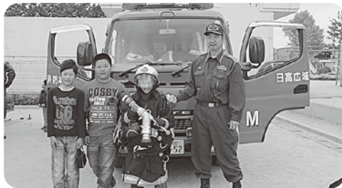
水陸両用車や消防車もお目見え