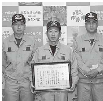
梅の郷救助隊の皆さん

を訪れ、物資を届けたり、被災者の要望により建物の撤去や行方不明者の捜索など献身的に尽くされ、被災地の皆さんから大変感謝されました。