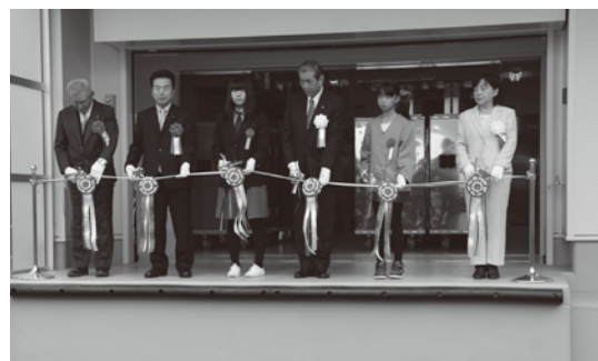
南部小・中学生代表を交えて

従来は、出来上がった商品を検査することで安全性を確保しようと考えられていましたが、流通が複雑化している今日、最終の検査だけでは危害を防止する事が困難になってきています。そこで、仕入れや材料等の段階で考えられる原材料や器具、設備、調理する人などに関係するすべての危害を予測、分析し、その発生原因を取り除くなど衛生管理上重要な工程を重点的に管理するために考えられたシステムです。