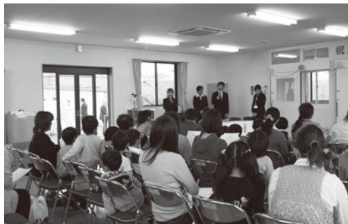
3人の指導員を紹介

き2箇所目の開所となります。軽量鉄骨平屋建、延床面積135.41㎡、元にあつた倉庫などの取り壊し費を含めた工事費は375.9万円で、保育室と静養室を兼ねた事務室の他、トイレや給湯室を備えています。