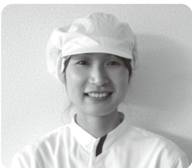
学校給食センター調理員