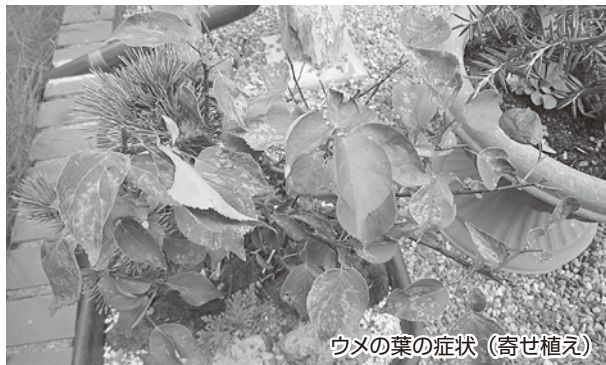
ウメの葉の症状(寄せ植え)