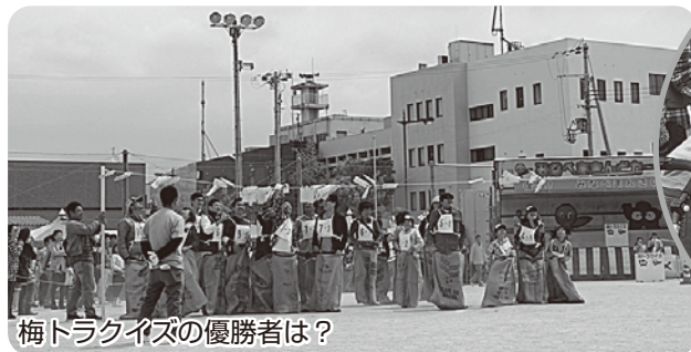
梅トラクイズの優勝者は?