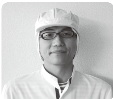
学校給食センター調理員