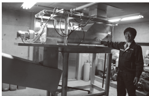
新しい設備を紹介する漁協職員

氷不足の解消により、今まで苦労してきた漁獲物の鮮度保持が容易となり、また、氷の搬出についても、組合員がカード操作によつて自分で搬出できるようになったため、仕事の段取りがつきやすくなり、所得の向上にも繋がっていくと思われま