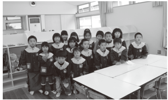
新しい保育室で全員集合