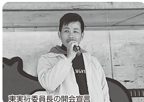
東実行委員長の開会宣言