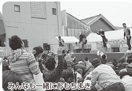
みんなもおもちまき