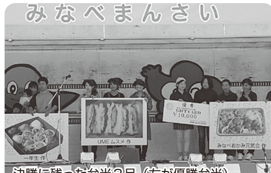
決勝に残った弁当3品 (左が優勝弁当)