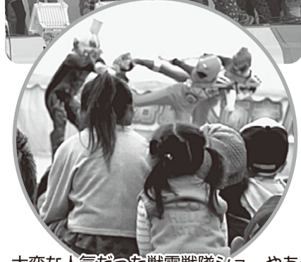
大変な人気だった獣電戦隊ショーやあきんどエクスプレス