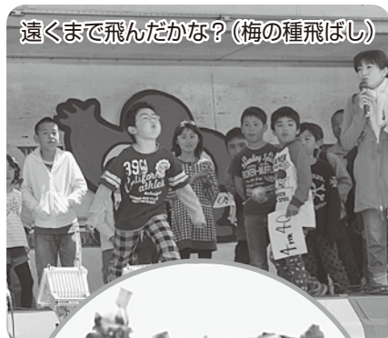
遠くまで飛んだかな?(梅の種飛ばし)