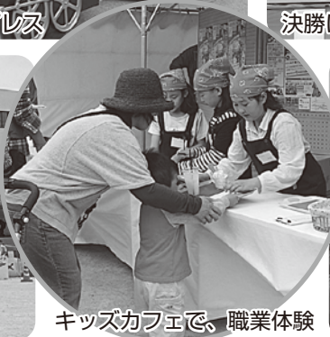
キッズカフェで、職業体験