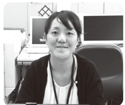
保健福祉課主事補