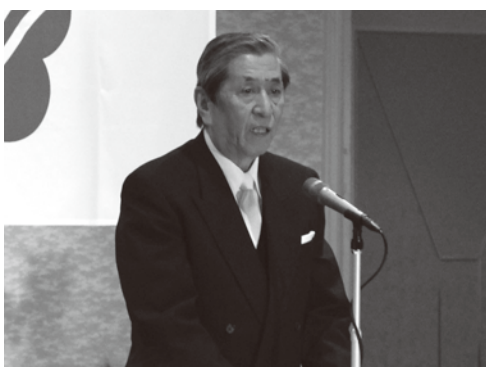
町長から新成人に祝辞

式典の後、引き続き新成人の集いが開催され、中学3年生の時の担任の先生方からのお祝いの言葉や、実行委員の皆さんが企画されたゲームなどを楽しみながら、久しぶりに出会った友達や恩師の先生方と楽しいひと時を過ごしました。