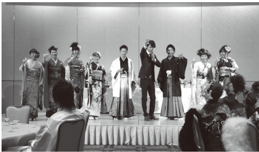
集いを企画運営してくれた実行委員の皆さん