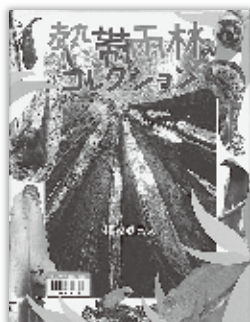
熱帯雨林のコレクション 横塚真己(ラレーベル館)

世界6か所の熱帯雨林を豊富な写真で紹介。地上の生き物の種類の半分以上がすむ熱帯雨林は命のつながりを実感させてくれる「生命の宝箱」です。