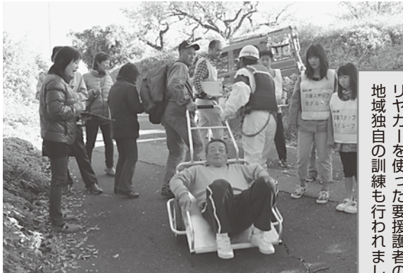
小学生によるアンケート調査を実施。自主防災会では、リヤカーを使った要援護者の搬送訓練やAEDの講習など、地域独自の訓練も行われました。

ことによって皆さんの関心を高め、地域全体で防災に関する意識が共有できることを期待しています。