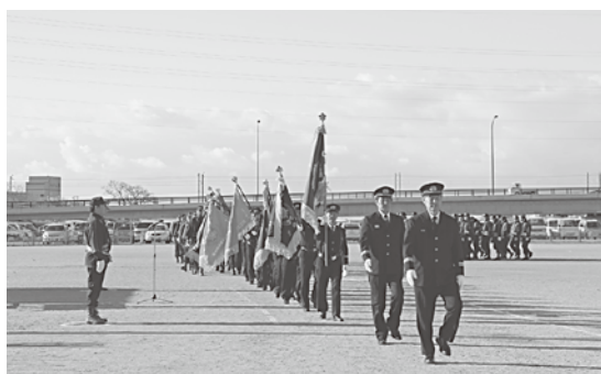
昨年の出初め式の分列行進の様子

1月7日(月)午前9時から、みなべ町消防団の出初め式を行います。(午前8時に消防団員招集のためのサイレンを鳴らします。) 式では、約300人の消防団員と各婦人防火クラブ代表の皆さんが、一堂に会して今年1年の防災への決意を新たにします。 ●場所 町民広場(気佐藤・南部川河川敷)※雨天の時は、南部小学校体育館 なお、式終了後、団員の皆さんは、須賀橋付近の河川敷