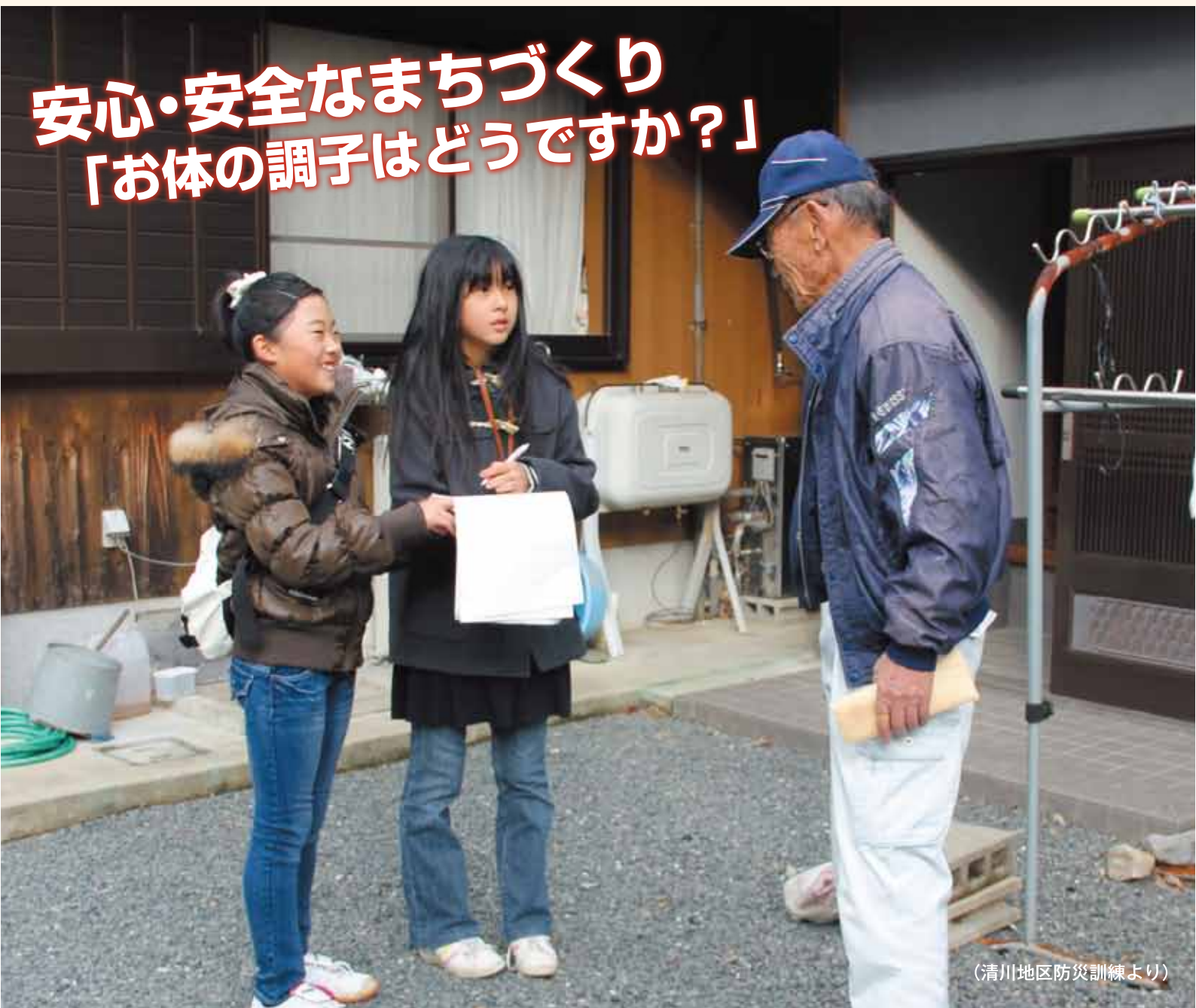
(清川地区防災訓練より)