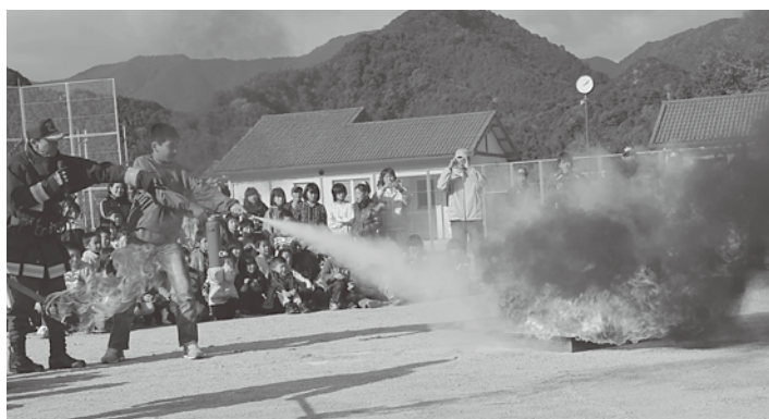
地区内の危険個所の確認や、色々な訓練を体験しました。