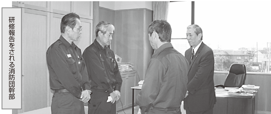
研修報告をされる消防団幹部

発電機などの備品（火事ですぐ必要のないもの）の高台保管や十分な燃料の備蓄、通信伝達手段などを町に提案し、町、消防団、地域住民が一体となった、防災対策への更なる取り組みについて再確認しました。