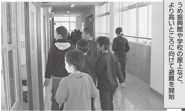
うめ振興館や学校の屋上など、より高いところに向けて避難を開始