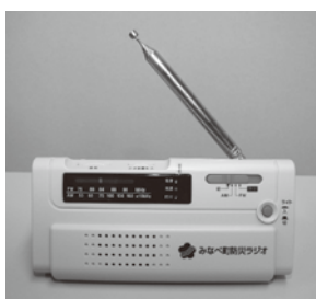
旧村地域に配布した防災ラジオ

今年度の防災訓練は、小学校と地域が連携して取り組むことにより、防災教育と地域住民への波及の相乗効果をねらい、地域ごとに実施する予定です。