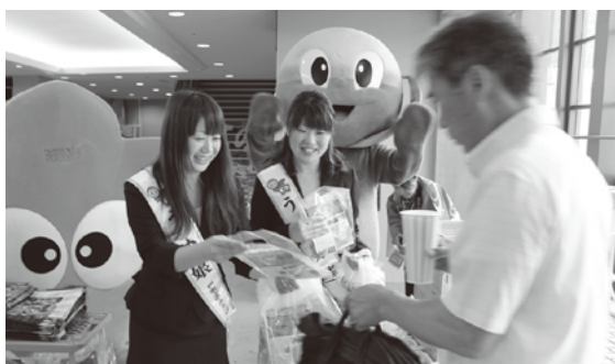
来場者にチラシでPR

町は5月17日(木)、阪神甲子園球場(兵庫県)で『紀州みなべ南高梅ナイター』と銘打ったイベントを行いました。球場の入場ゲート8ヶ所で、先着来場者5000人に、梅(3粒入りパック)と梅の効能について紹介したチラシが入った袋を手渡し、「みなべの梅とみなべ町」をPRしました。