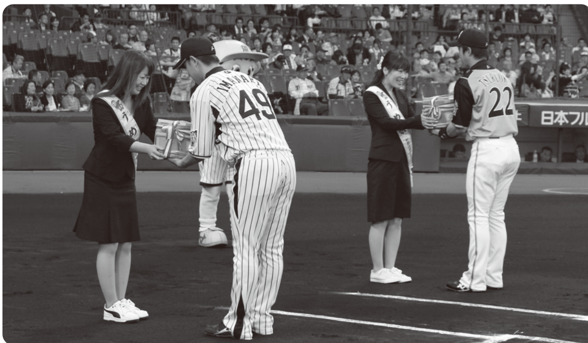
梅娘から代表選手に梅干しのミニたるを贈呈

このイベントも今年で7回目を見向かえ、毎年恒例イベントとして定着しており、PR袋を受け取った方から、「毎年おいしく頂き、楽しんでいます。」と喜ばれたり、「どんな味をするんですか?」と、袋に入っている梅について聞かれるなど、みなさん、みなべの梅に興味をもたれたようです。