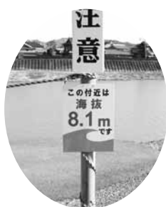
各地に設置された 海拔表示板