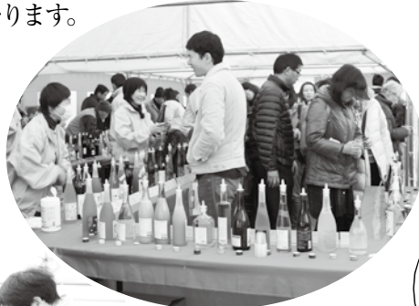
全国各地からたくさんの梅酒が集まりました