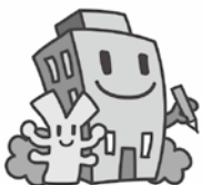
経済センサスキャラクター

総務省・経済産業省・和歌山県・みなべ町 経済センサス・活動調査については、キャンペーンサイトをご覧ください。