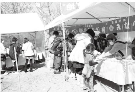
子どもにも人気だった梅料理