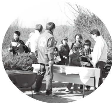
紀州備長炭で焼いた梅餅やウルメイワシをみなさんに