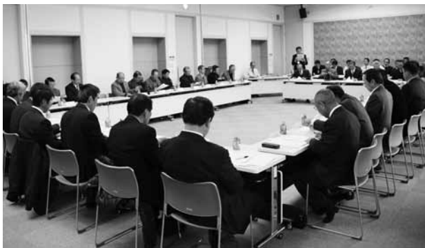
新区長さんが 初区長会で顔合わせ