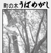
町の木 うばめがし