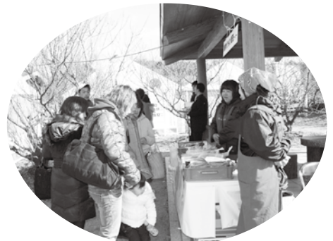
海産物の販売や梅ジュース作り体験

また、海産物の販売や、紀州備長炭で焼いたウルメイワシやさば、梅干しを入れた梅餅なども振舞われ、来場された皆さんは、「梅の花が咲いていなくて残念だったけど、おいしいみなべの産物が食べられて良かった。」と喜んでいました。