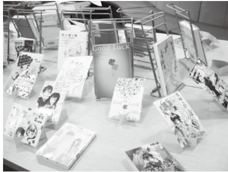
昨年の「ポップ大賞展」の様子

恒例の南部高校と神島高校の「ポップ大賞」入賞作品に、今年も、それぞれの高校図書館便りもあわせて展示させていただきますので、ぜひご覧ください。