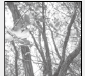
町の木 うばめがし