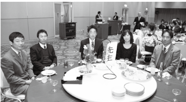
新成人の中学校時代の恩師もお祝いに来てくれました