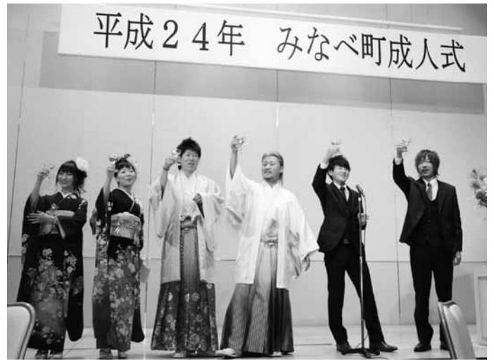
集いを企画運営してくれた実行委員の皆さん