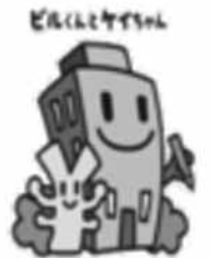
経済センサスキャラクター