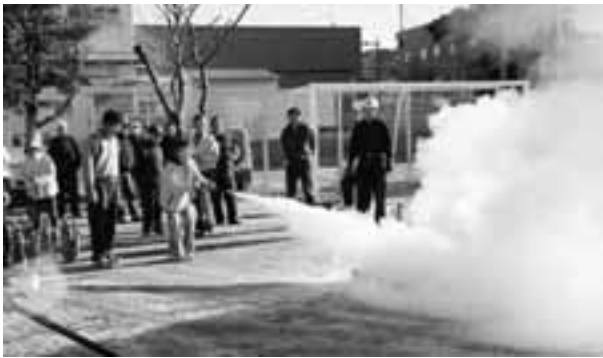
消火器による初期消火訓練