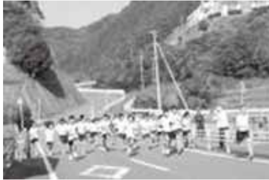
高城中学校の生徒たち

11月から12月にかけて、町内各小・中学校で、校内マラソン大会が行われました。子どもたちは、学年や性別ごとに決められた距離を、沿道からの保護者たちの声援を受けながら、より良い記録をめざして元気いっぱい走りました。