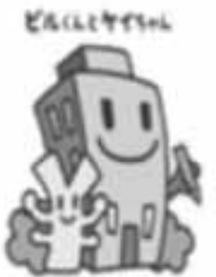
経済センサスキャラクター

この調査は「経済の国勢調査」です。会社やお店など全国すべての企業・事業所が対象です。