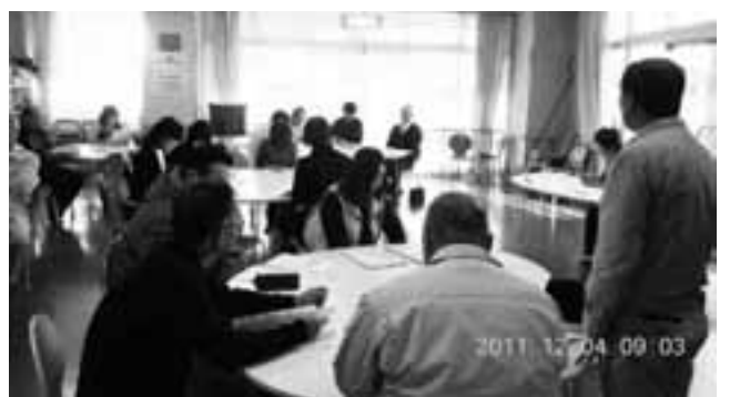
福祉避難所についての検討会(ふれ愛センター)