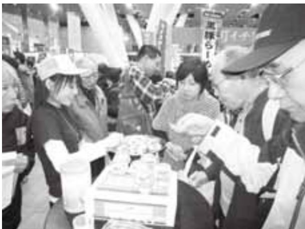
梅干しの試食をされる来場者の皆さん

両日とも大変な賑わいで、試食を勧めると口コミで広がり、持ち込んだ商品は2日目の午前中に完売するほどの盛況ぶりでした。