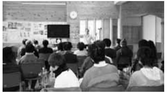
避難場所や経路など情報交換会