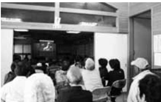
地震・津波について講話やビデオで勉強会