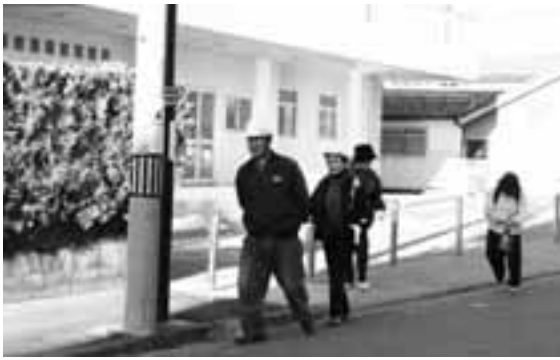
サイレンを聞いて各避難場所へ避難開始

災害は、いつ起きるかかわかりません。日頃からいざという時の行動について考え、災害に備えることが重要です。また、地域での連帯感を深めることが、地域防災力の向上につながります。