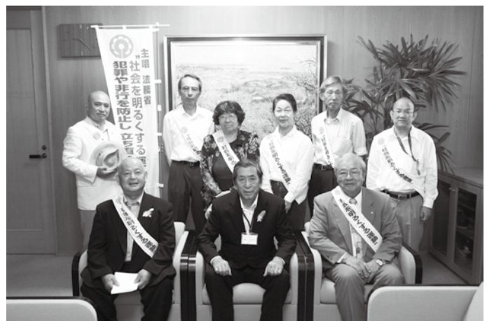
田辺保護司会みなべ分会のみなさん