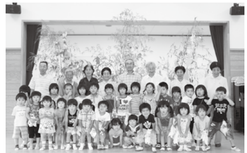
高城保育所の園児と長寿クラブのみなさん