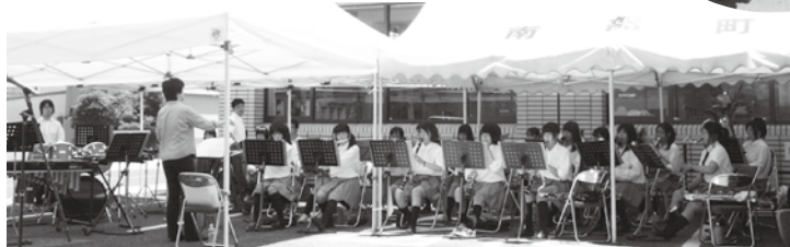
南部高校吹奏楽部のみなさん