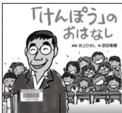
「けんぼう」のはなし 井上ひさし/原案 武田美穂/絵(講談社)

昨年なくなった井上ひさしさんが、小学生に語りかけた記録をもとにした「けんぼう」の絵本。「けんぼう」って何なのか、何のためにあるのか、根本がすっきりと分かります。