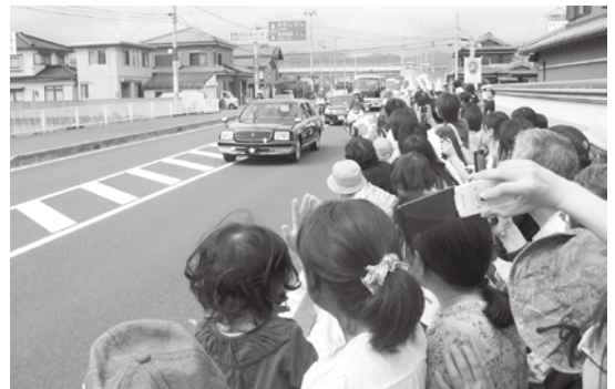
沿道での奉送迎の様子