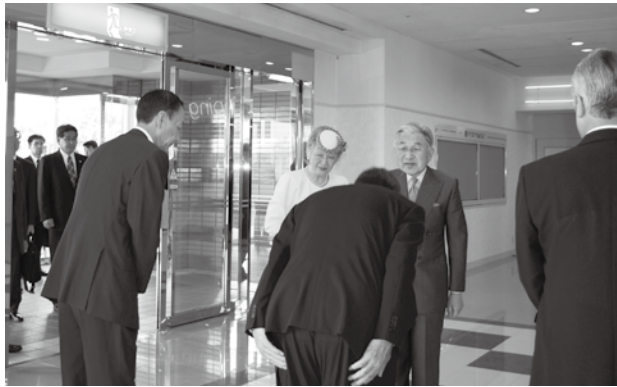
ホテルでお迎える町長と議長

5月22日（日）、田辺新庄総合公園で天皇皇后両陛下御臨席のもと、「緑の神話 今そして未来へ 紀州木の国から」を大会テーマに第62回全国植樹祭が開催されました。