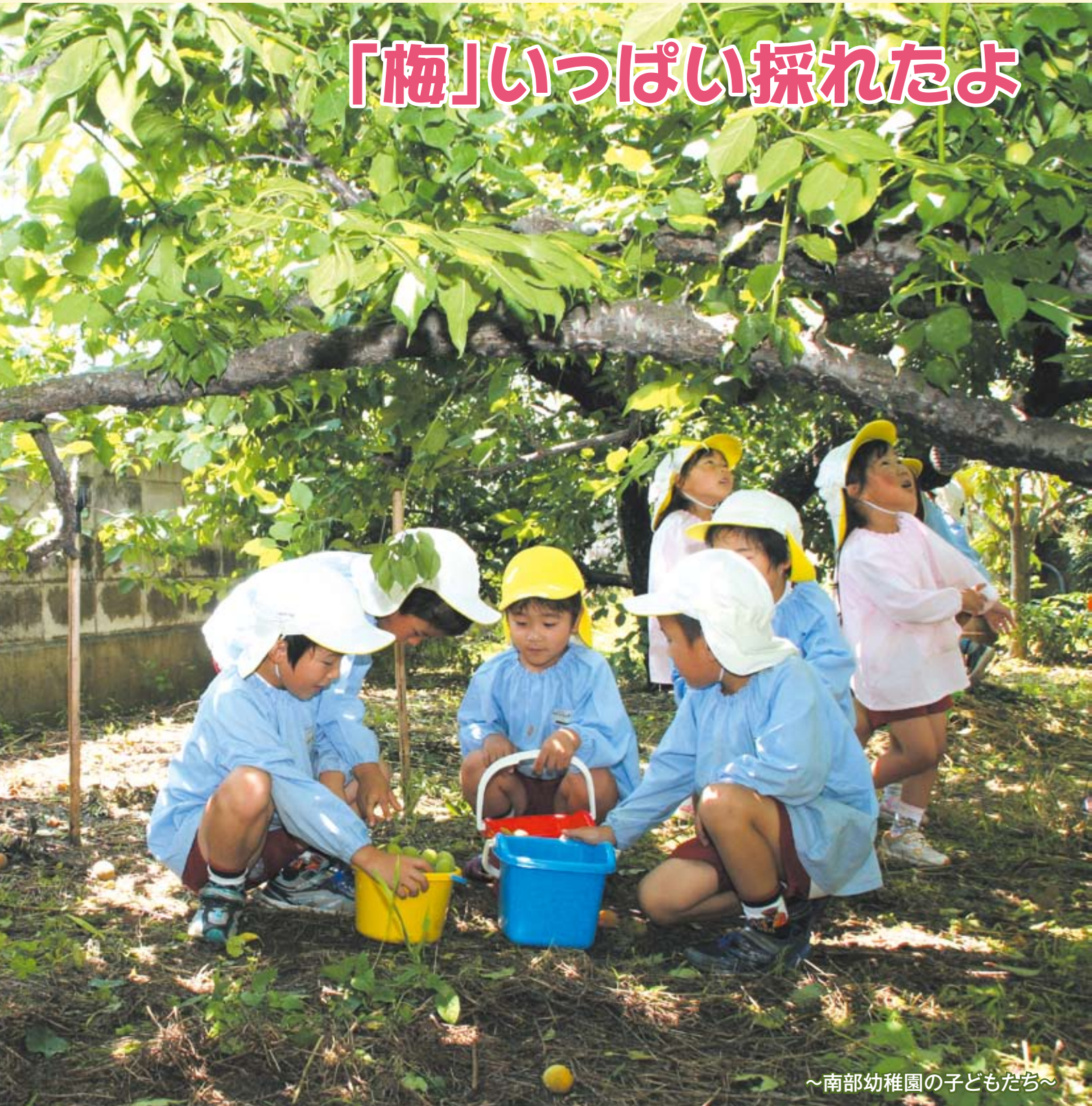
～南部幼稚園の子どもたち～