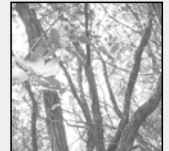
町の木 うばめがし