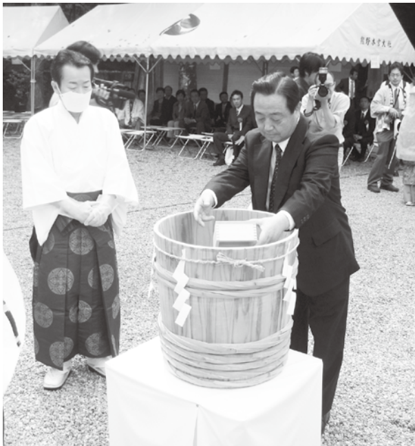
▲ 本宮大社で梅漬けの神事