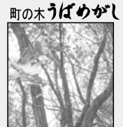
町の木 うべめがし