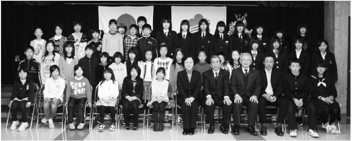
文化賞授与式に出席した受賞者の皆さん