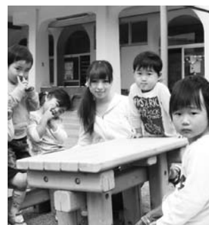
南部保育所保育士