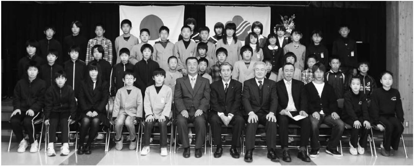
スポーツ賞授与式に出席した受賞者の皆さん

3月25日(金)、平成22年度みなべ町スポーツ賞・文化賞の授与式(町体育協会・町文化協会主催)が、生涯学習センターで行われました。この賞は平成22年度にスポーツや文化活動で活躍された方々に贈られたものです。 受賞されたのは次の皆さんです。なお、学年は3月25日現在です。(敬称略)