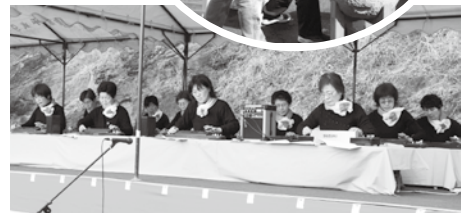
千里クラブの大正琴演奏