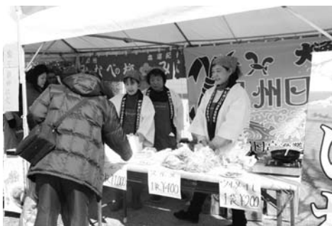
海産物販売コーナー

2月12日（土）、南部梅林内の「梅林公園」で、今年初めて企画された町の物産を紹介する「オールみなべの物産展」が、開催されました。会場では、紀州備長炭で焼いたウルメイワシが振る舞われ、梅ジュースの試飲や梅干しの試食などもあり、大勢の観梅客で賑わいました。また、梅ジュース作り