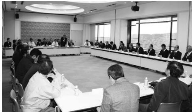
初区長会で一堂に集まった新区長さん

の選任も行われ、会長に軽井川区長の裕幸男さん、副会長に南道区長の濱田卓郎さんが選ばれました。