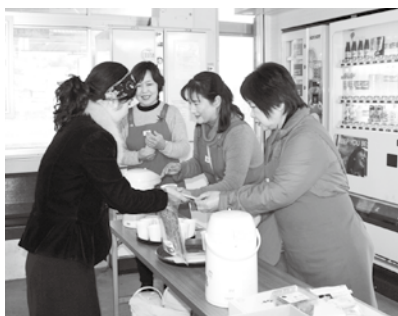
町商工会女性部の梅茶サービス