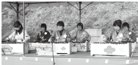
みなべ炭琴クラブの炭琴演奏