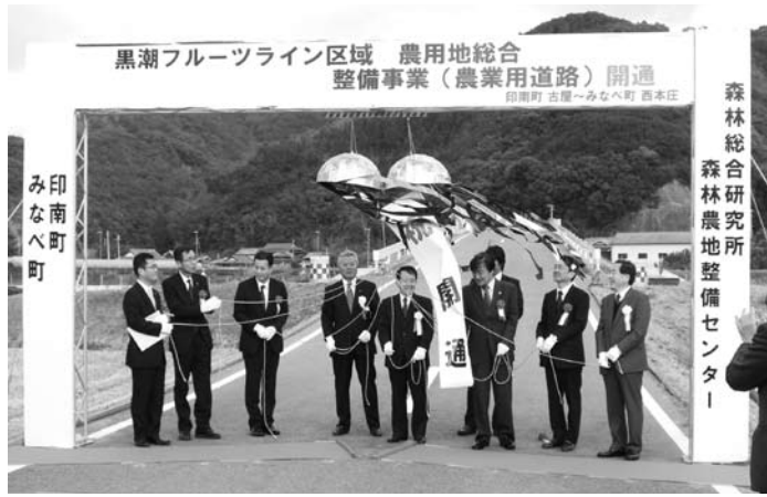
第一部 開通パレード出発式

産地である一方、農業基盤整備や道路整備が遅れていることから、農産物流通や都市との交流等に支障を来たしていましたが、そのため農地の区画整理や暗渠排水、農用地造成を行い、農業用道路などを整備することで、収穫量の増加や流通の利便性を向上させ、地域農業の活性化を図ることなどを目的に、平成13年度より事業が実施されました。