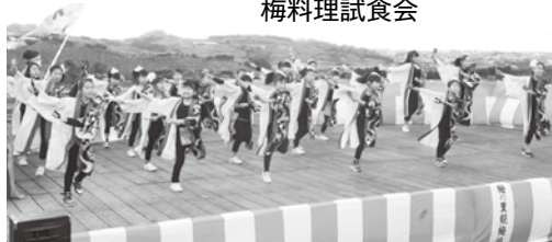
プラリズム～梅舞～のよさこい踊り