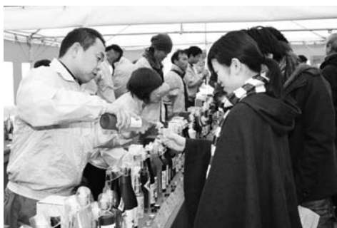
梅酒コレクション会場

今年も観梅期間中の2月11・12日の両日、南部梅林内の「梅林公園」で、梅酒の試飲会「梅酒コレクション2011 in みなべ」が、開催されました。