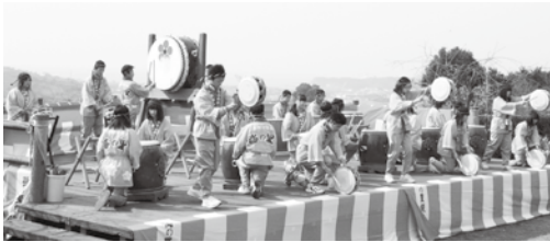
上南部中の紀州梅林太鼓