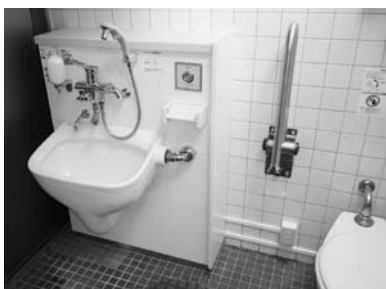
オストメイト対応トイレ(うめ振興館駐車場横トイレ)

また、国民宿舎紀州路みなべ1階と鶴の湯温泉宿泊棟1階の身体障がい者用トイレを、簡易オストメイト対応トイレに改修しました。これで、町内のオストメイト対応トイレは、役場第一庁舎1階トイレと併せて5箇所となりました。