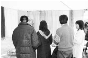
梅染め展示コーナー

2月12日（土）、南部梅林内の「梅林公園」で、今年初めて企画された町の物産を紹介する「オールみなべの物産展」が、開催されました。会場では、紀州備長炭で焼いたウルメイワシが振る舞われ、梅ジュースの試飲や梅干しの試食などもあり、大勢の観梅客で賑わいました。また、梅ジュース作り