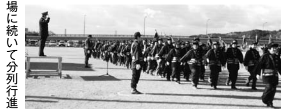
団旗入場が続いて分列行進