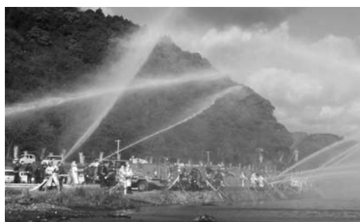
須賀橋付近河川敷で行われた放水訓練