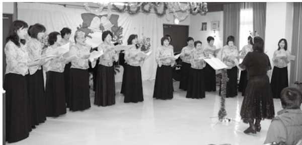
プラムコーラスの皆さん

来場者は、きれいな合唱や演奏に聴き入り、時には一緒に口ずさみながら、楽しいコンサートのひとときを過ごしていました。