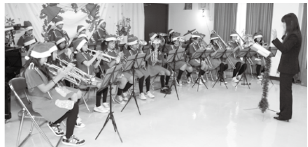
ジュニアバンドの皆さん