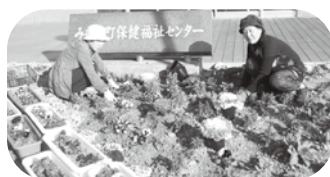
花の植え替え作業

トレーニング教室 ～はあと館(社会福祉センター)～ 2月4日(金)・18日(金)・25日(金) 18:00～21:00