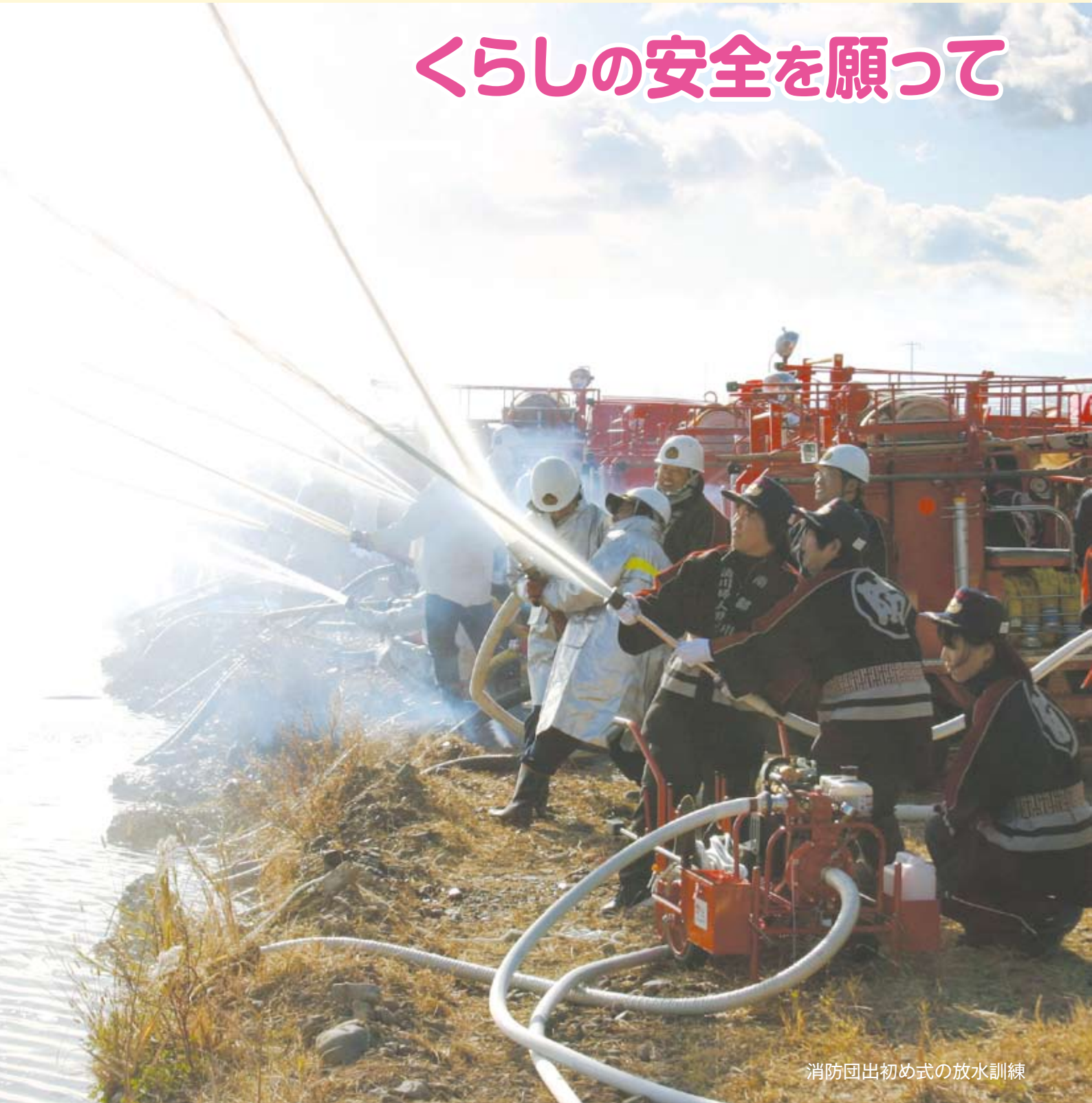
消防団出初め式の放水訓練