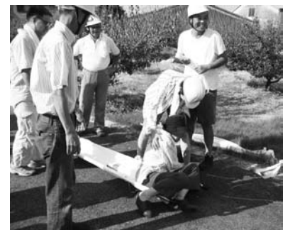
負傷者などの救護訓練（気佐藤区）