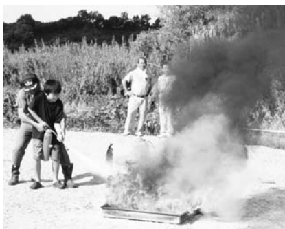
消火器を使用して初期消火訓練（新庄区）

今回初めて、町職員の防災訓練で、実災害を想定した図上訓練を実施しました。初災から約2時間までの初期対応訓練として、午前8時30分災害対策本部を設置、あらかじめ想定した被害状況を各部署へ伝達