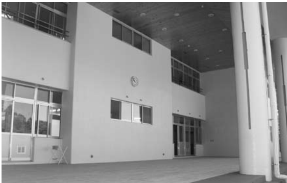
屋外イベント広場