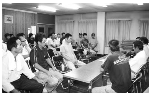
災害対策本部を設置（東岩代区・西岩代区）