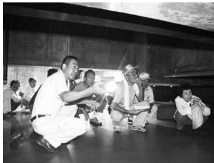
南部小の免震構造装置の見学（芝区）