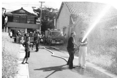
可搬式ポンプを使用して消火訓練（新町区）