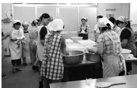
炊き出し訓練 （東岩代区・西岩代区婦人防火クラブ）