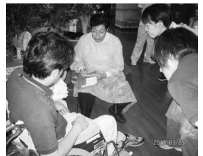
救護所を開設しての訓練 （ふれ愛センター）