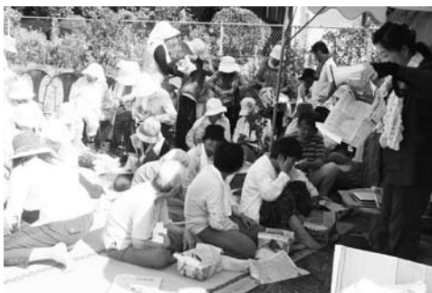
「災害時のトイレに関する知識、簡易式トイレの作り方」講習会（東吉田区）