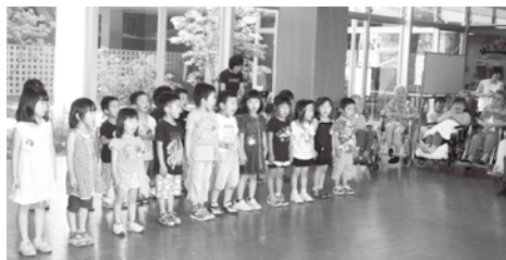
愛之園保育園園児が「虹」を訪問