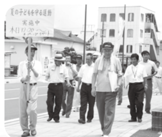
◀「みんなで子どもたちを守りましょう」

終了後、セレモニーの参加者が街頭啓発を行い、町民に運動への協力を呼びかけました。夏の子どもを守る運動期間は、7月1日～8月31日です。