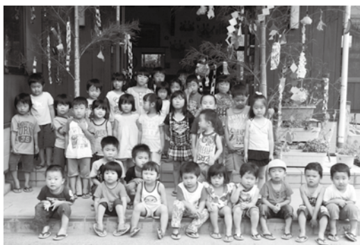
ひかり保育所の園児たち