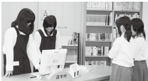
7月13、15日、ゆめよみ館で、南部高校2年生の生徒2人が、職業体験で図書館の仕事を手伝ってくれました。

町立図書館(ゆめよみ館) TEL72-1410 上南部分館(生涯学習センター内) TEL74-3283