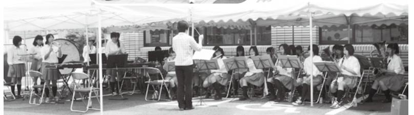
暑い中演奏してくれた ▼ 南部高校吹奏楽部