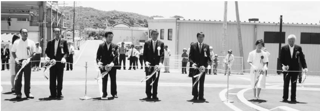
みなべ新橋の開通を祝って行われたテープカット

式典では、町長式辞や来賓祝辞、事業の経過報告などが行われ、その後、みなべ新橋に移動して、開通を祝うテープカットと渡り初め式が行われました。気佐藤側の橋の入り口で、下宏