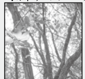
町の木 うばめがし