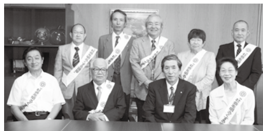
田辺保護司会みなべ分会の皆さん

また、7月6日（火）、南部中学校では、生徒会役員や教員、保護司さんたちが、登校してきた生徒にポケットティッシュとチラシを配って、運動の啓発を行いました。