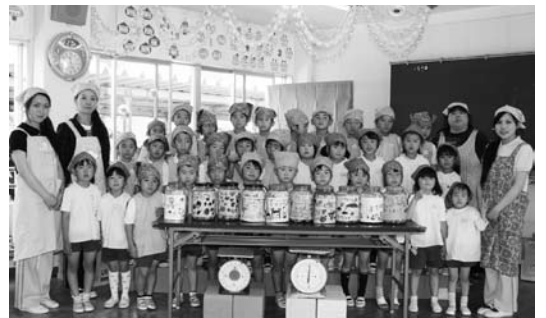
南部幼稚園で梅ジュース作り

高城保育所は、6月のクッキングで、園で育て収穫したじゃがいも・玉葱・梅を使って、「梅コロッケ」を作りました。4・5歳児の園児たちが、かわいい手付きでコロッケを形作り、昼食には揚げたての梅コロッケをおいしくいただきました。