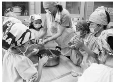
高城保育所で梅料理作り

高城保育所は、6月のクッキングで、園で育て収穫したじゃがいも・玉葱・梅を使って、「梅コロッケ」を作りました。4・5歳児の園児たちが、かわいい手付きでコロッケを形作り、昼食には揚げたての梅コロッケをおいしくいただきました。