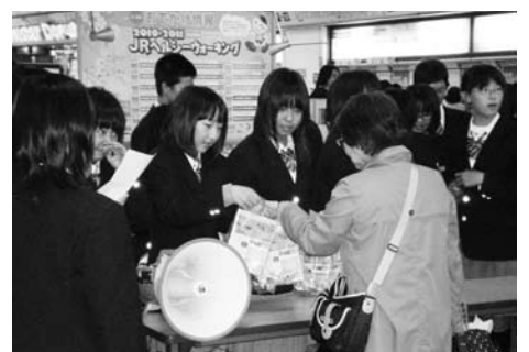
上南部中学校の生徒たち

駅構内で梅干しを配り「紀州みなべの南高梅」をPRしました。後日学校へ、「梅のPR活動に感激。梅も大変おいしかった。」とお礼の電話が入ったそうです。また同じく、高城中学校3年生が、6月4日、修学旅行先の東京ドーム前で梅干しを配りPR活動をしました。清川中学校3年生は、6月21日、沖縄県で梅のPR活動をしました。