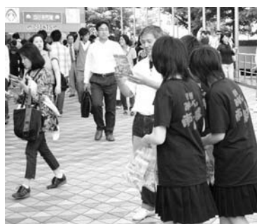
高城中学校の生徒たち