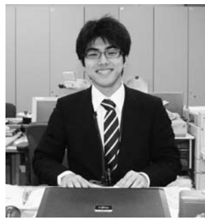
保健福祉課主事補

「窓口業務などを担当しています。早く仕事を覚えて、住民の皆さんのお役に立てるよう頑張りたいです。」