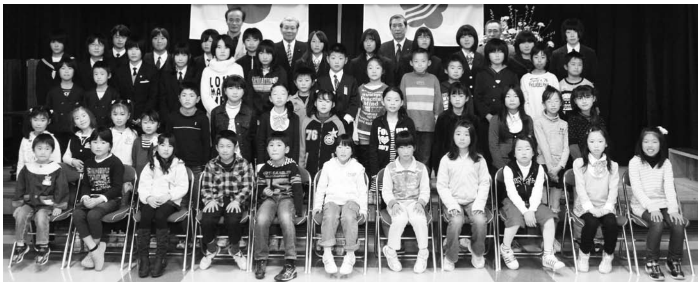
文化賞授与式に出席した受賞者の皆さん