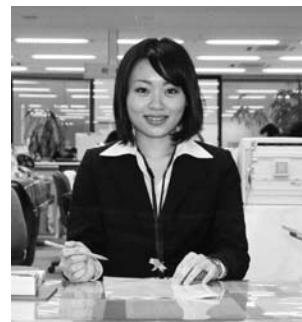
住民環境課主事補