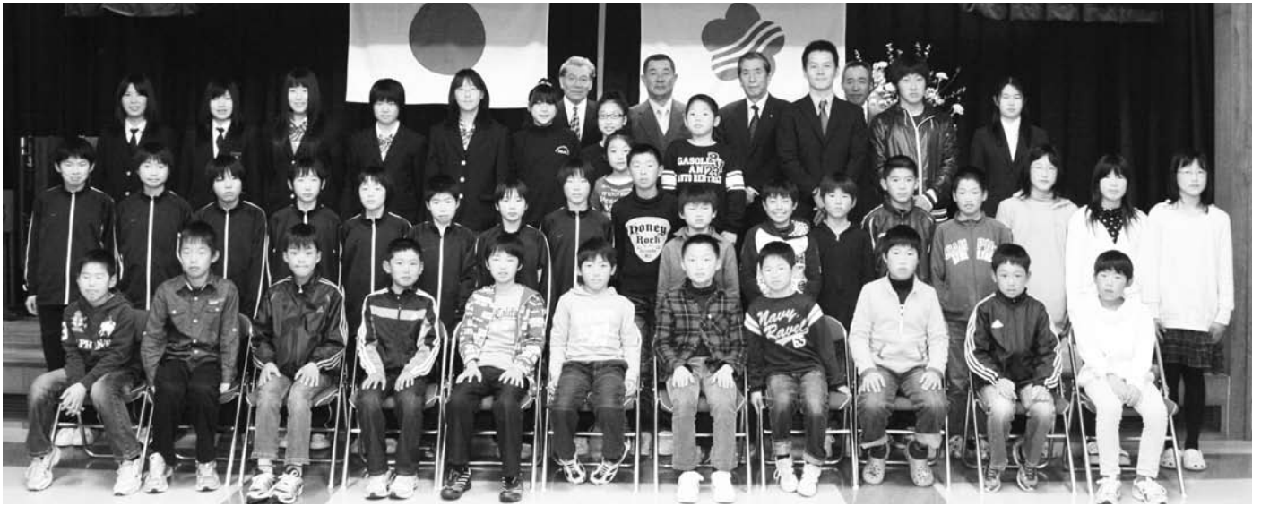
スポーツ賞授与式に出席した受賞者の皆さん

3月25日(木)、平成21年度みなべ町スポーツ賞・文化賞の授与式(町体育協会・町文化協会主催)が、生涯学習センターで行われました。この賞は、21年度に各種スポーツ・文化活動で活躍された方々に贈られたものです。受賞されたのは次の皆さんです。なお、学年は3月25日現在です。(敬称略)