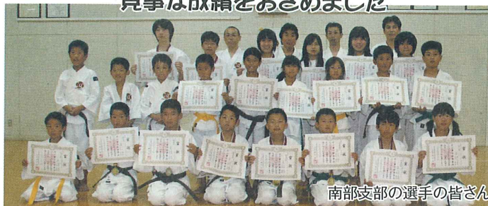
南部支部の選手の皆さん

6月28日(日)、2009年少林寺拳法県民体育大会が岩出市で開催され、南部支部の選手の皆さんが、下記のように優秀な成績をおさめました。