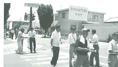
「みんな子どもたちを守りましょう」