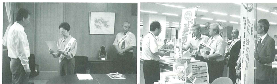
メッセージを伝達する田辺保護司会みなべ分会の皆さん

伝達の後、分会の皆さんは役場庁舎内や、町内のスーパーマーケットの店頭で運動の啓発チラシなどを配って啓発を行いました。