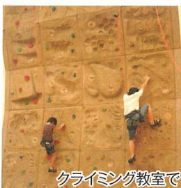
クライミング教室で