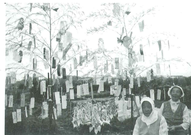
お楽しみ会の皆さんの七夕笹飾り