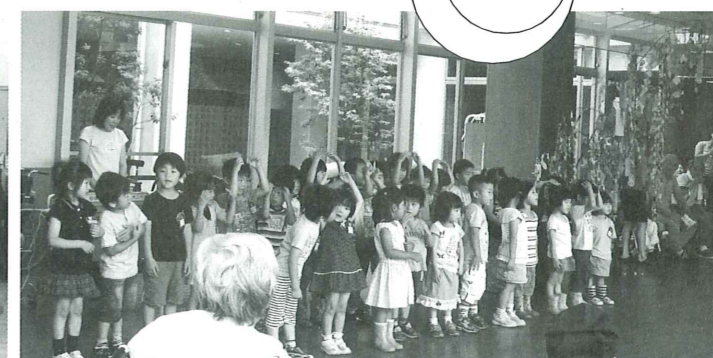
愛之園保育園園児が「虹」を訪問