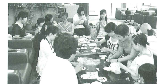
フェルトでアンパンマンを作る参加者たち