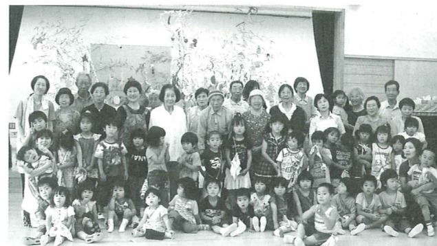
高城保育所園児と長寿クラブの皆さん