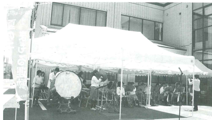
暑い中演奏してくれた南部高校吹奏楽部