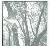
町の木 うばめがし